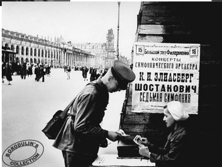
Карл Ильич Элиасберг - Главный дирижер Большого симфонического оркестра Ленинградского радиокомитета