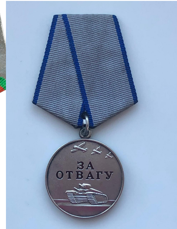
Медаль за отвагу