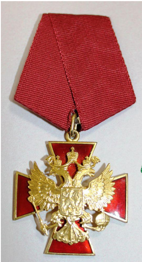
Орден «За заслуги перед Отечеством» IV степени