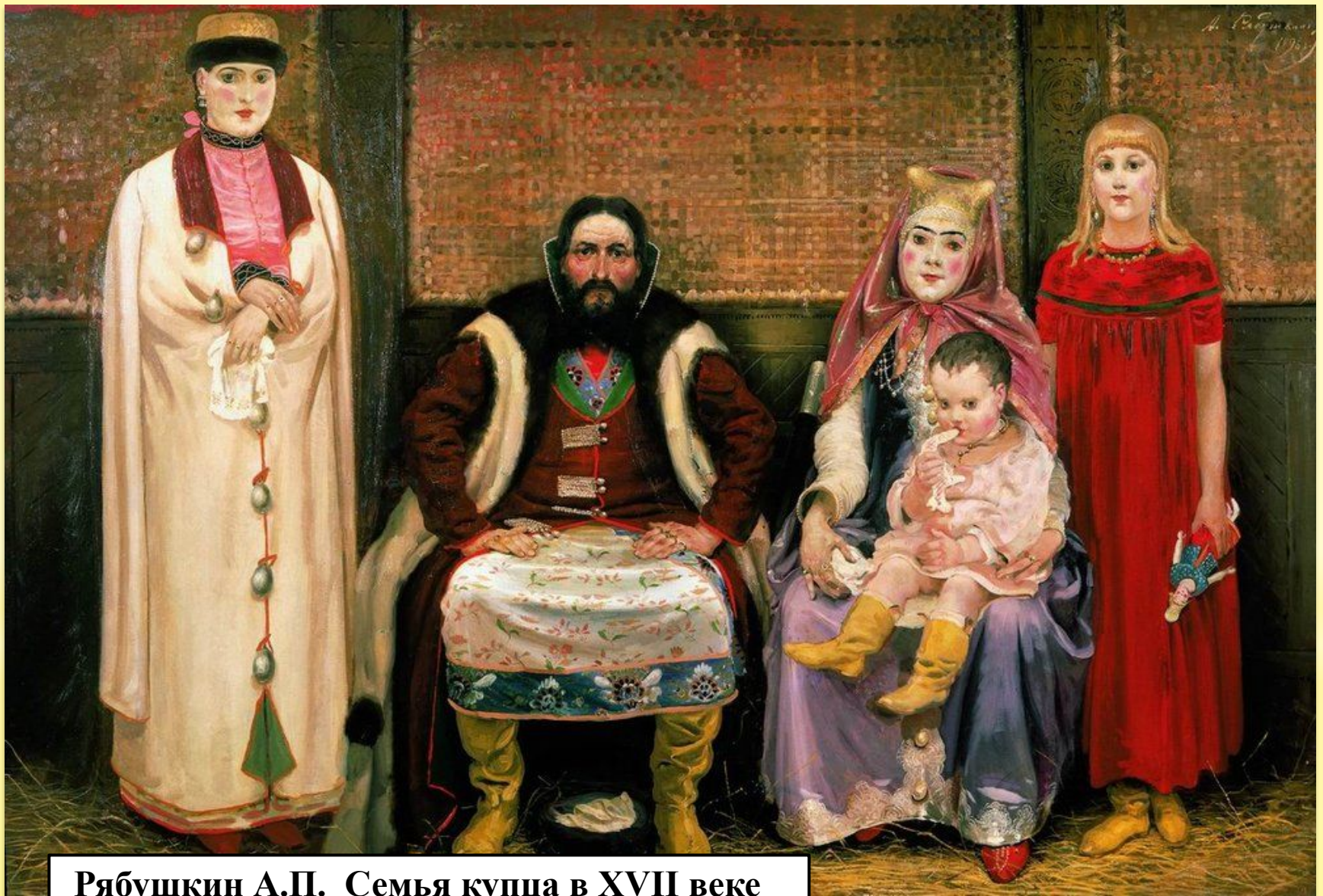
Рябушкин А.П. Семья купца в XVII веке