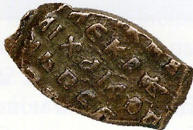
Медная копейка 1655 – 1662гг.