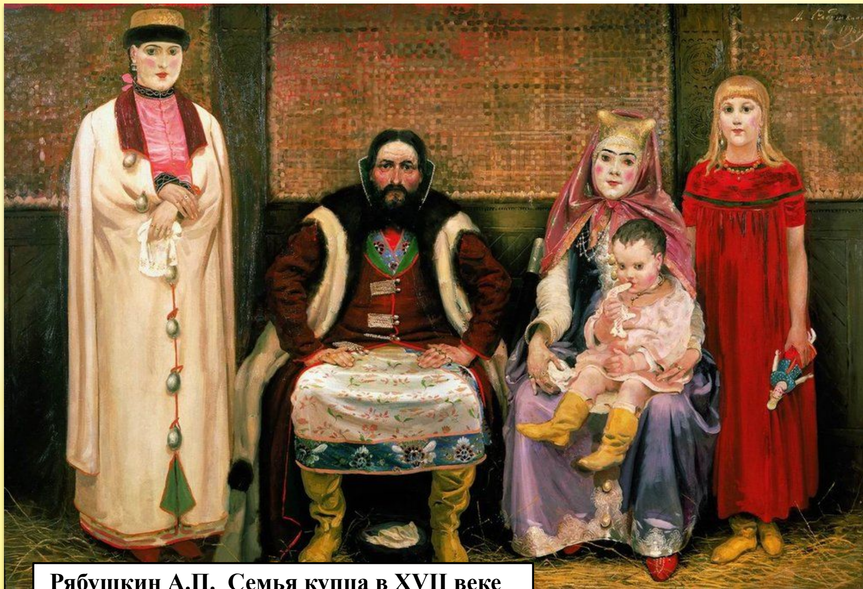
Рябушкин А.П. Семья купца в XVII веке