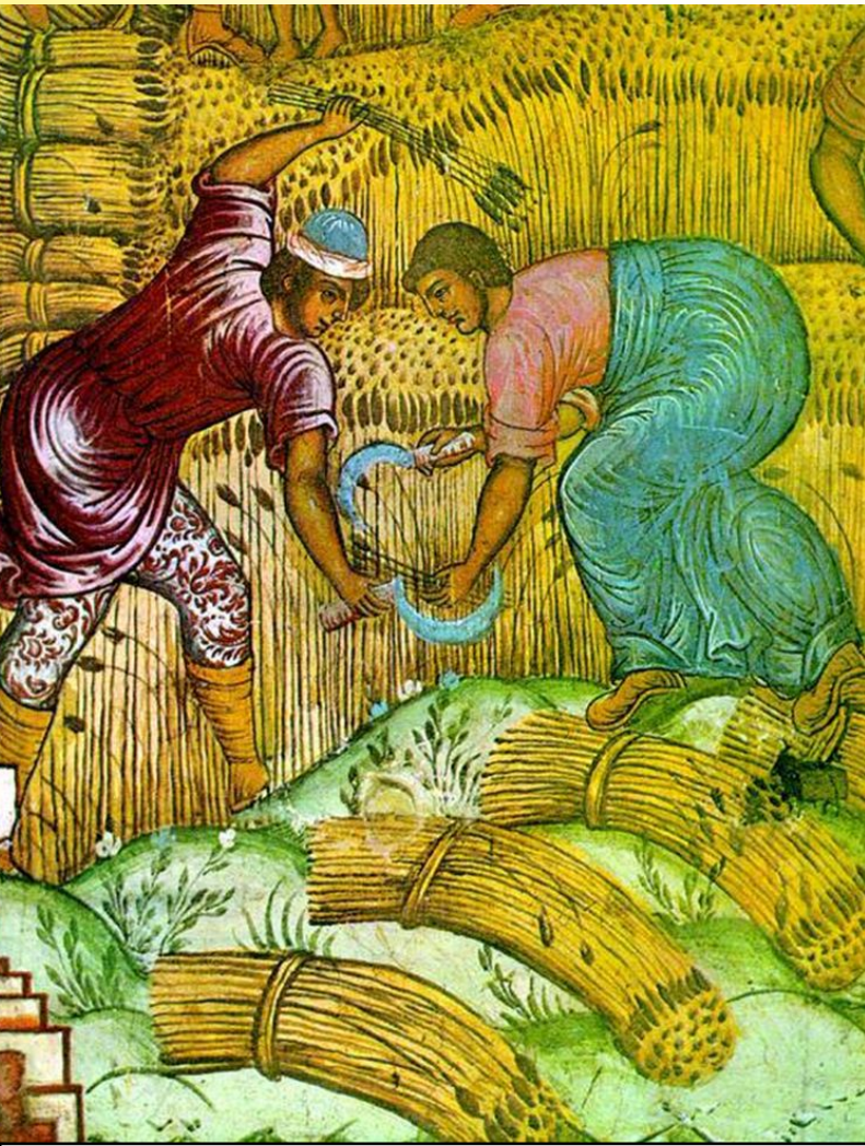
Фрески церкви Ильи Пророка в Ярославле. Жатва.Фрагмент