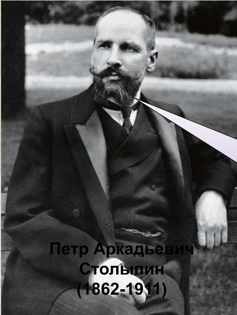
Петр Аркадьевич Столыпин (1862-1911)

9 НОЯБРЯ 1906 ГОДА – крестьянам разрешили ВЫХОДИТЬ ИЗ ОБЩИНЫ и ЗАКРЕПЛЯТЬ ЗА СОБОЙ ЗЕМЕЛЬНЫЕ НАДЕЛЫ