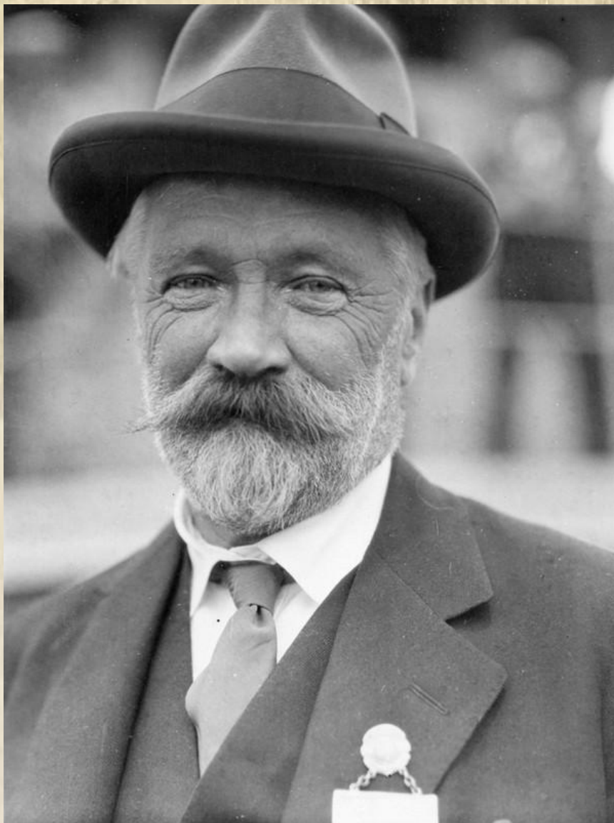
КОНСТАНТИН ДМИТРИЕВИЧ ГЛИНКА (1867-1927) Первый директор Воронежского сельскохозяйственного института