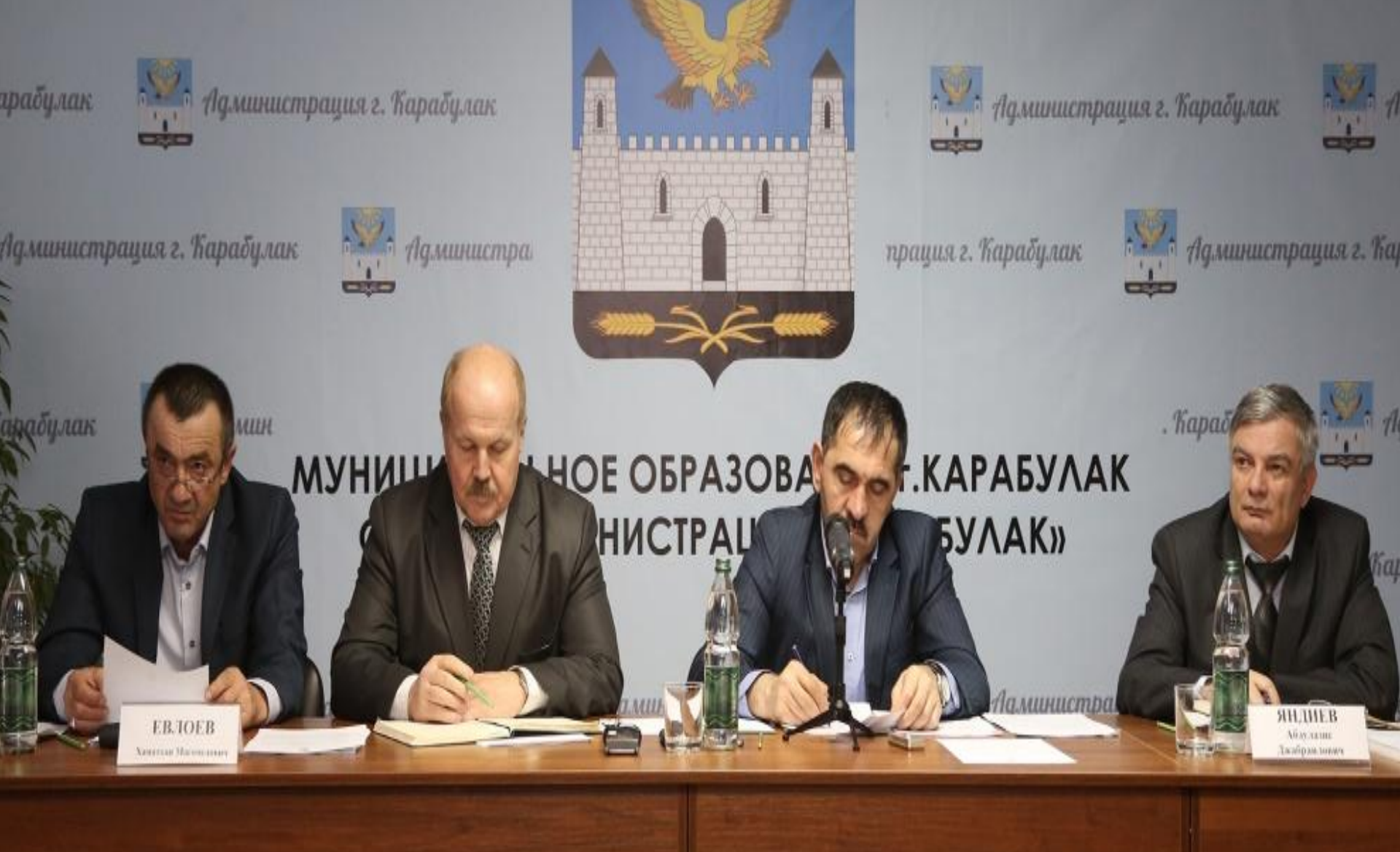
Первый съезд пчеловодов Республики Ингушетия с участием Главы РИ Евкурова Ю. Б.