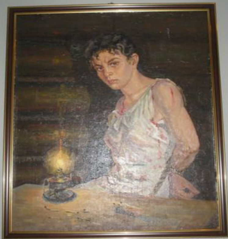
В плену врага, на допросе