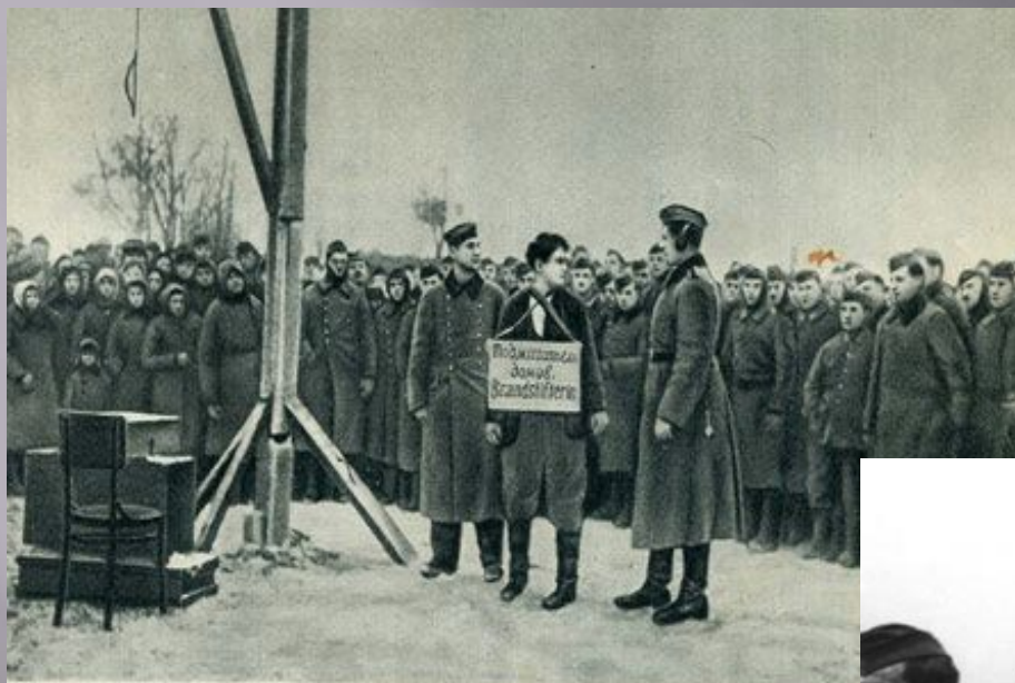
Зоя Космодемьянская перед казнью 29 ноября 1941 г., снимок взят у убитого немецкого офицера)