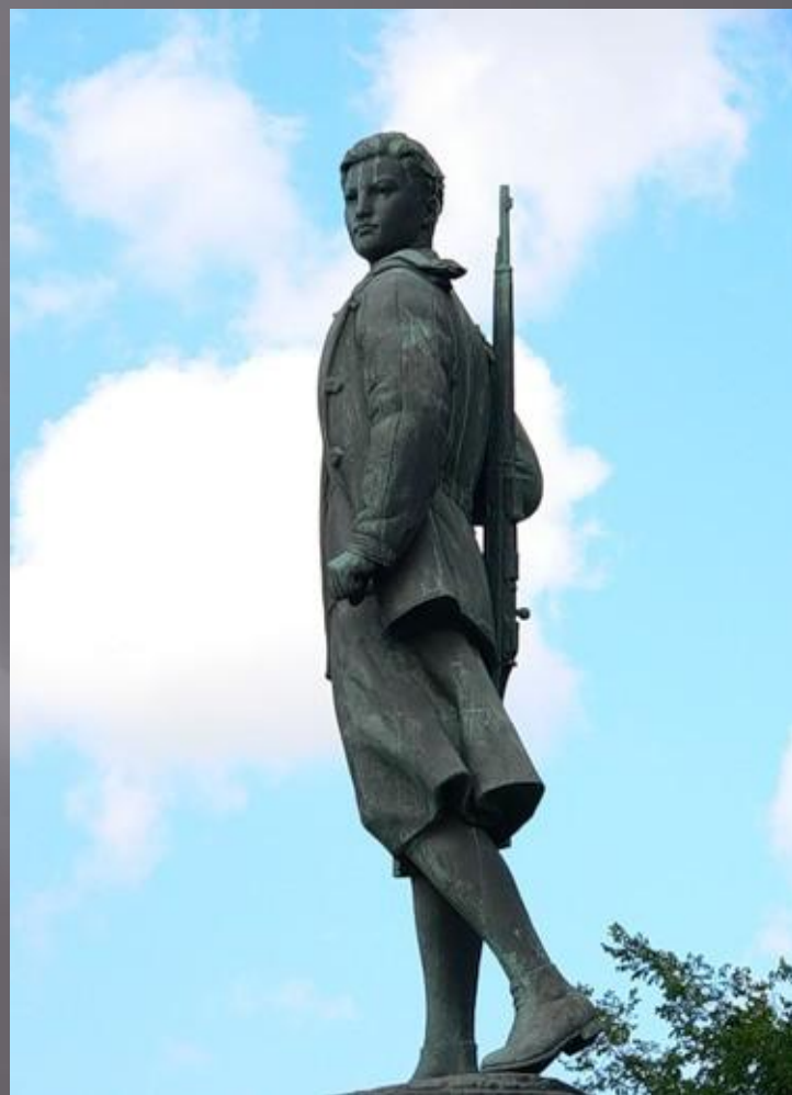
Памятник Зое Космодемьянской г. Тамбов