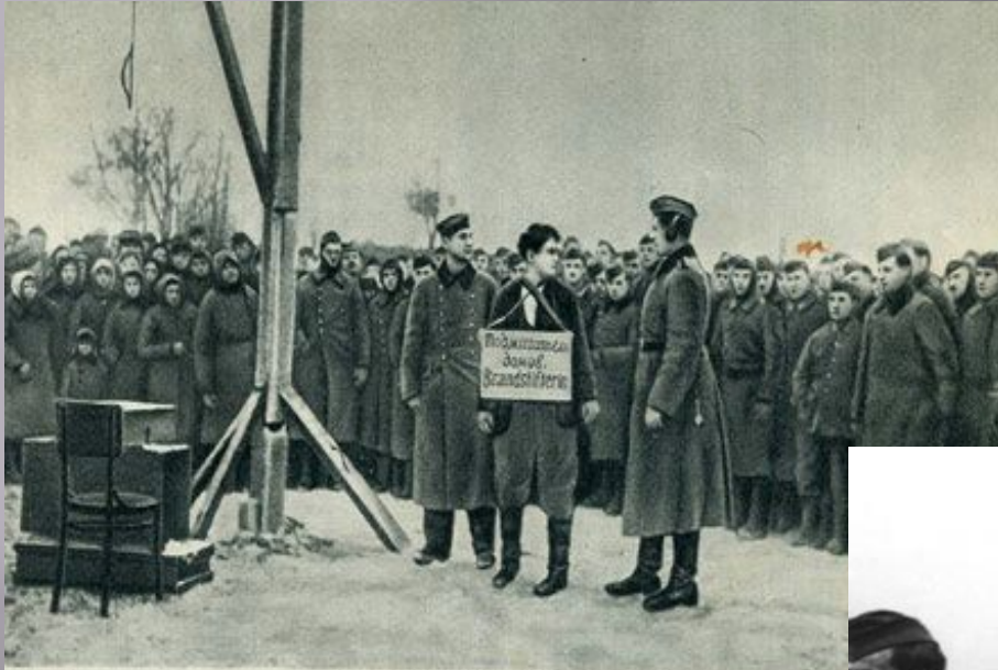
Зоя Космодемьянская перед казнью 29 ноября 1941 г., снимок взят у убитого немецкого офицера)