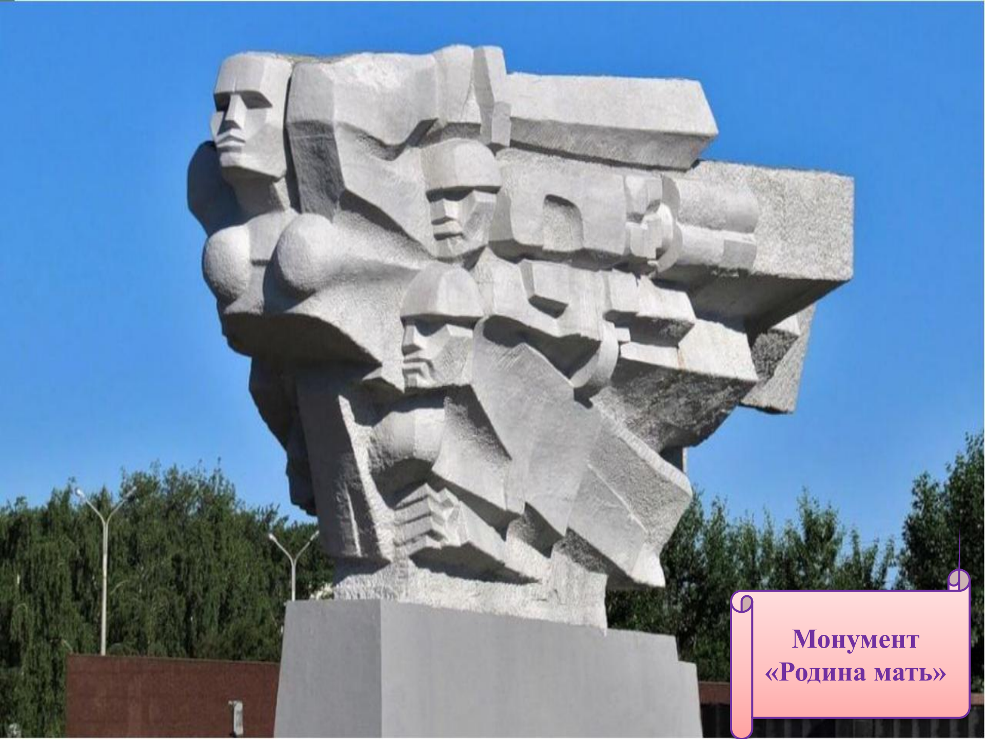
Монумент «Родина мать»