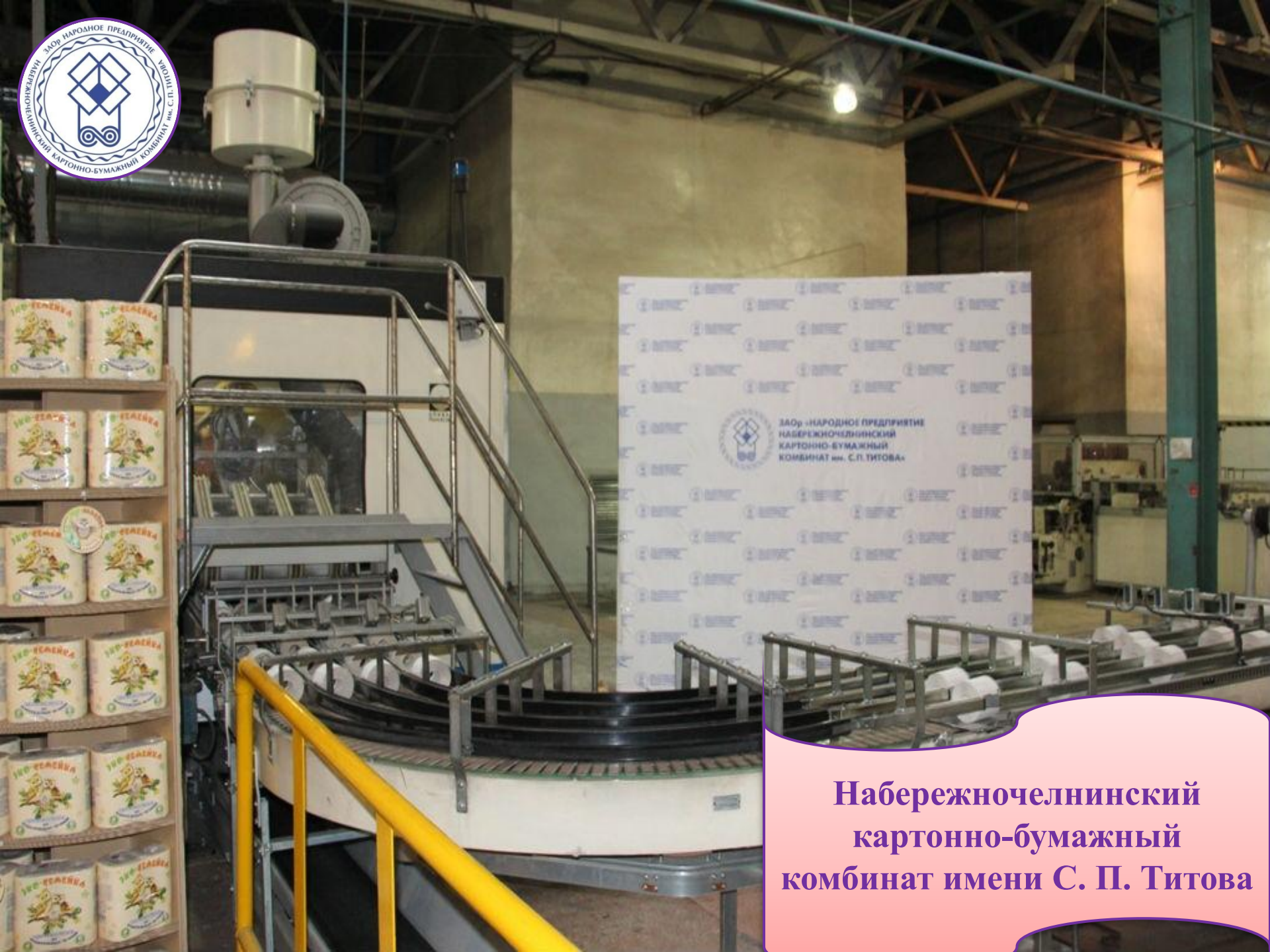
Набережночелнинский картонно-бумажный комбинат имени С. П. Титова