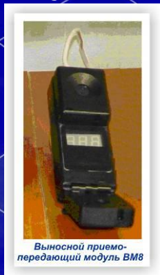
Выносной приемопередающий модуль ВМ8