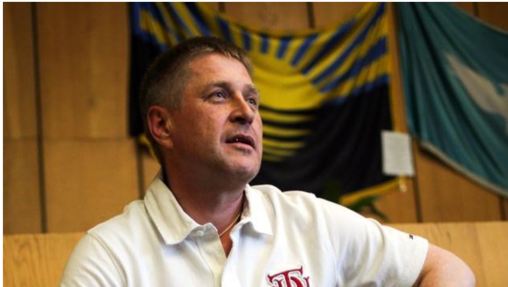
НАРОДНЫЙ МЭР СЛАВЯНСКА ВЯЧЕСЛАВ ПОНОМАРЁВ