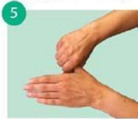
круговыми движениями тереть большие пальцы рук