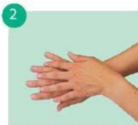
тереть левой ладонью по тыльной стороне правой кисти и наоборот