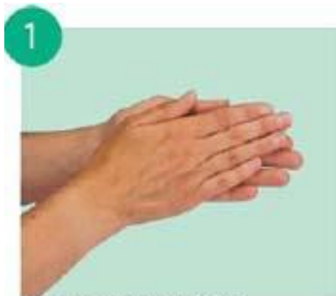
тереть ладонью о ладонь