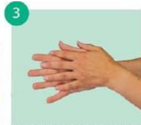
тереть ладони со скрещенными растопыренными пальцами