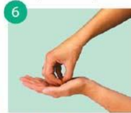
круговыми движениями тереть ладонь кончиками пальцев другой руки