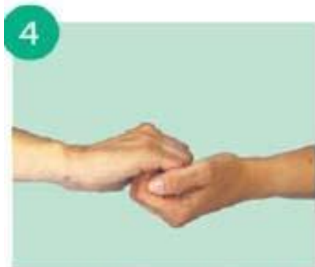
тереть тыльной стороной согнутых пальцев по ладони другой руки