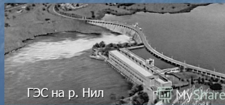
ГЭС на р. Нил