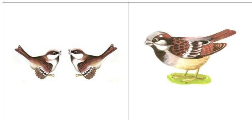
«Птица и птенчики»

Дети слушают звуки, если звук высокий, дети поднимают картинку с птенчиком, если звук низкий – поднимают картинку с птицей.