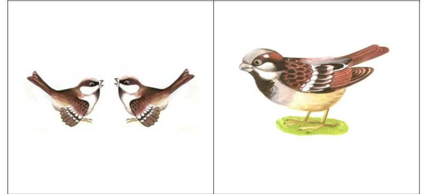
«Птица и птенчики»

Дети слушают звуки, если звук высокий, дети поднимают картинку с птенчиком, если звук низкий – поднимают картинку с птицей.