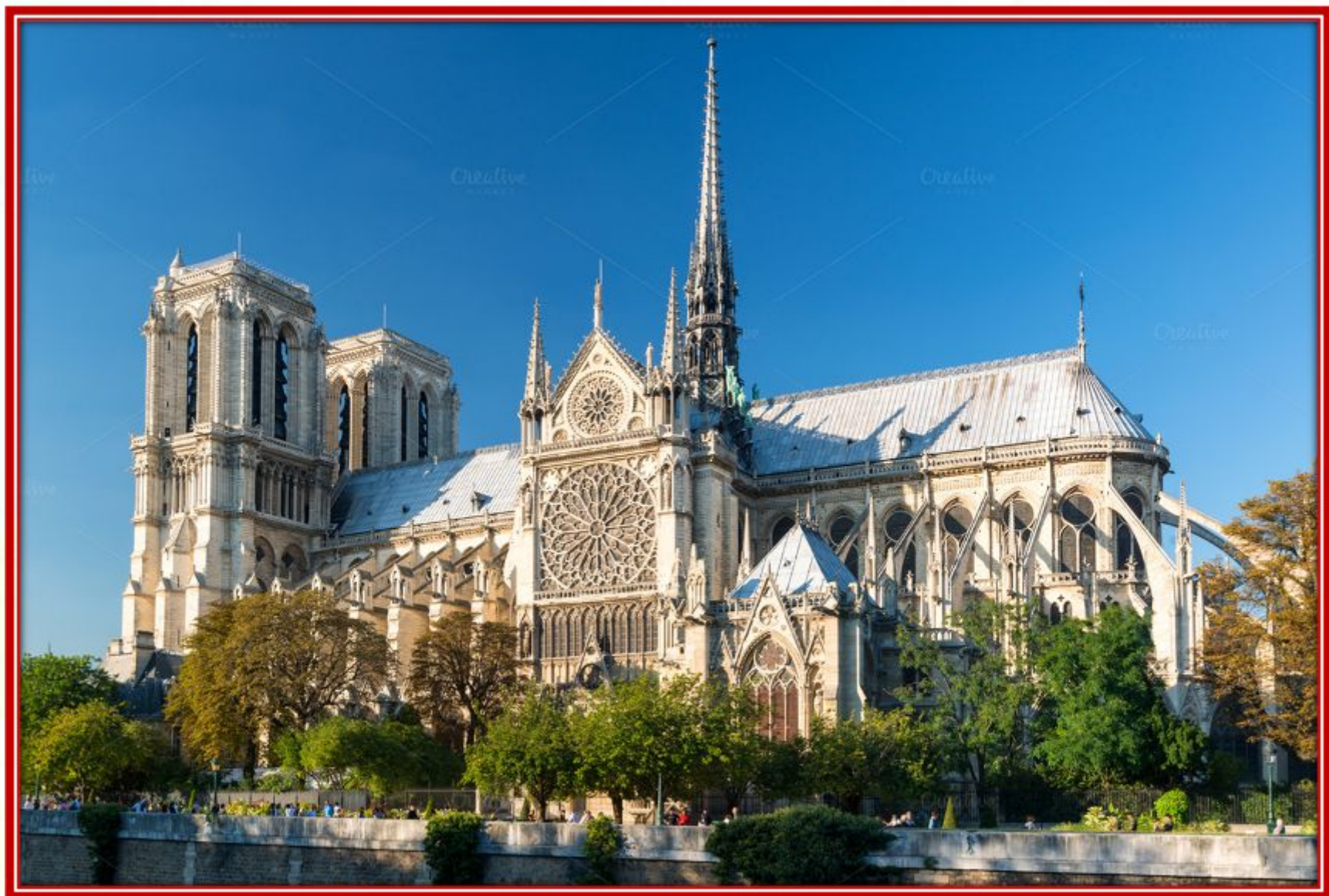
Нотр – Дам де Пари