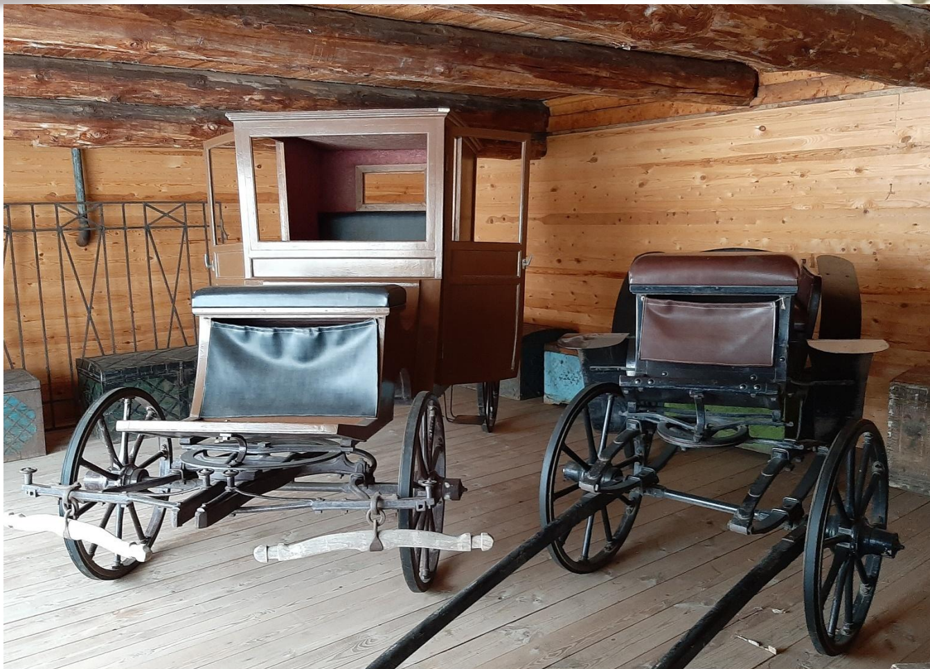
Транспорт, которым пользовалась семья Чайковских.