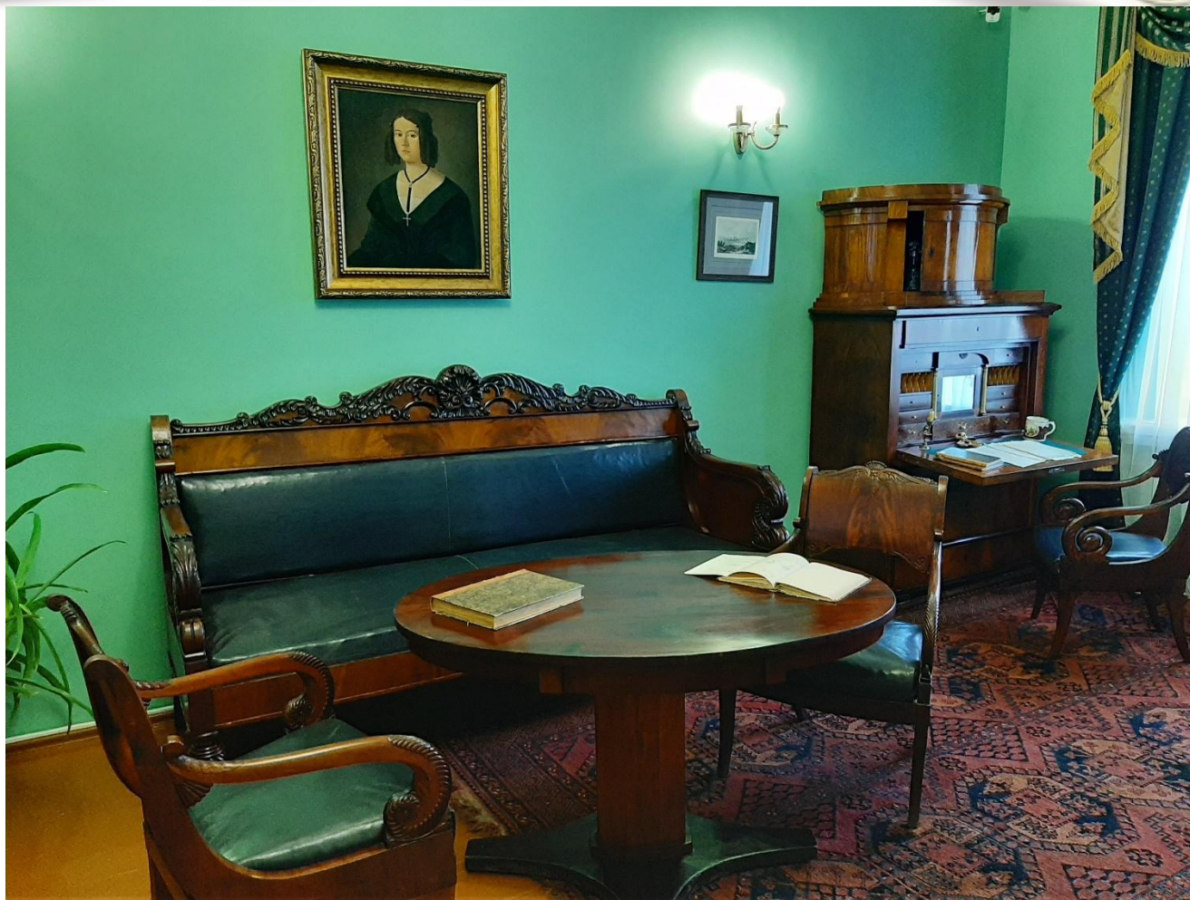
Рабочий кабинет отца Петра Ильича.