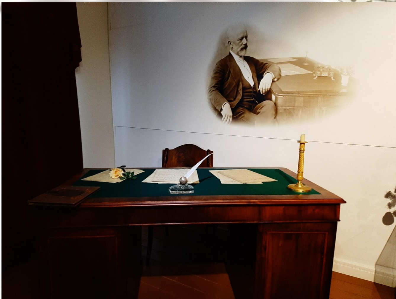
Рабочий стол П.И.Чайковского, за которым он писал свою великую музыку.