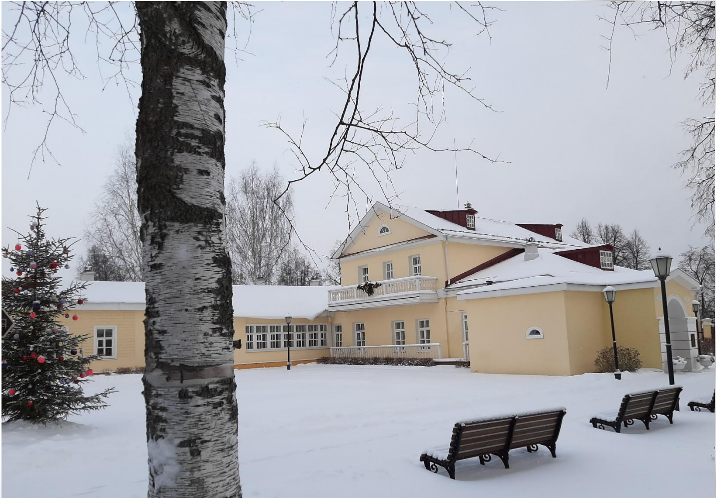
Дом в г.Воткинск, в котором провёл детство Петр Ильич.