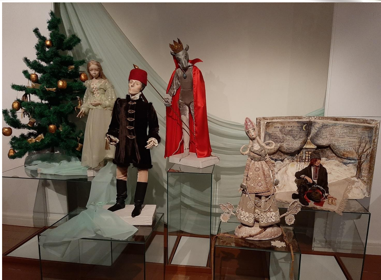
Герои произведений П.И.Чайковского (Щелкунчик, Мышиный король, Снегурочка, Микола)