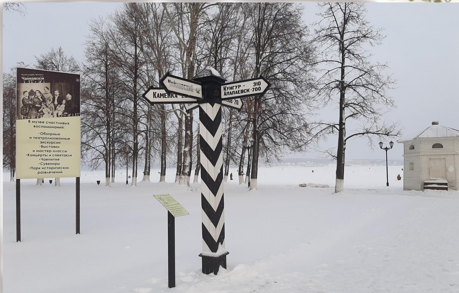
Указательный столб и стенд с фотографией семьи перед входом в музей П.И.Чайковского