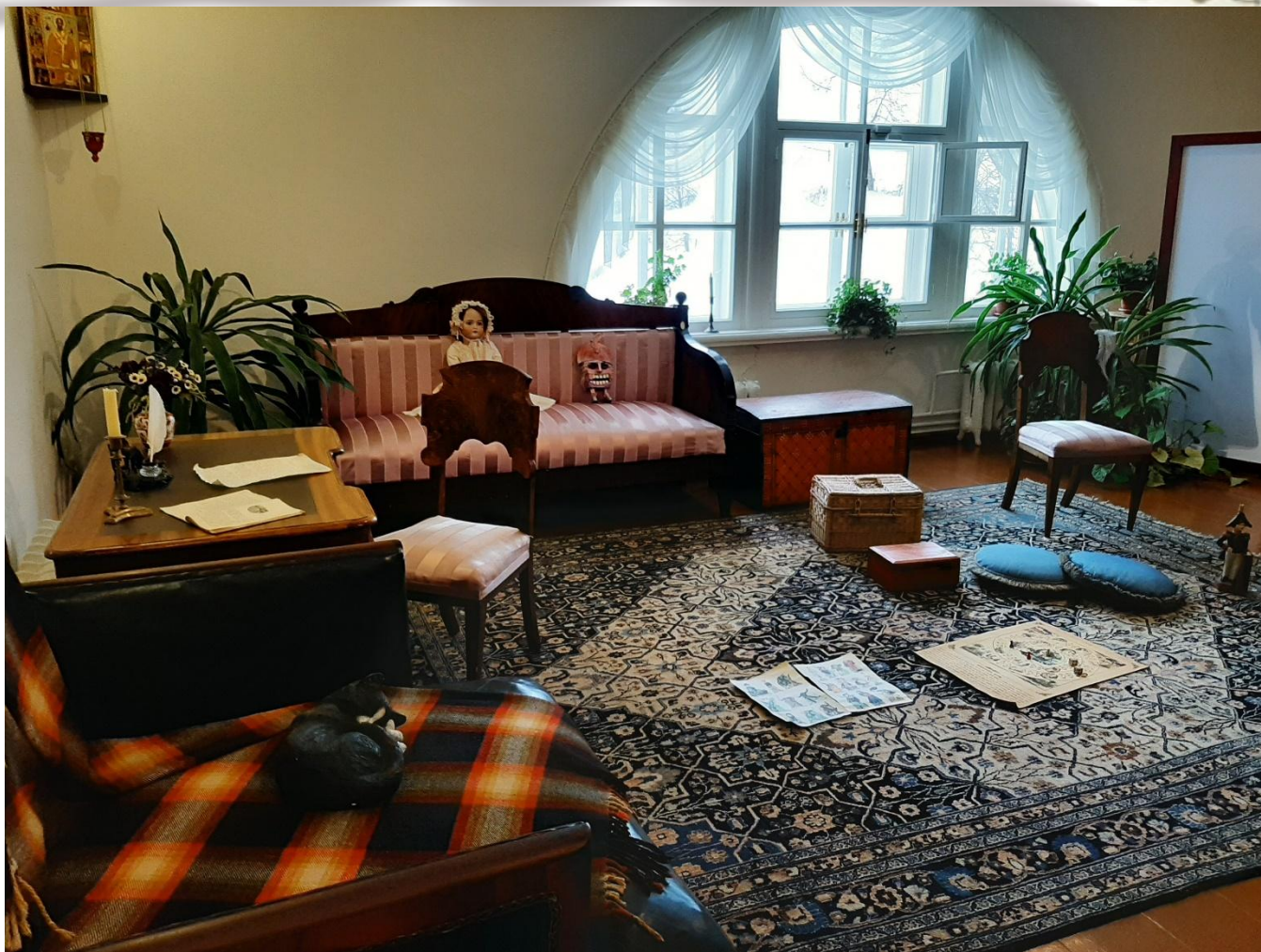
Игровая комната для детей семьи Чайковских.