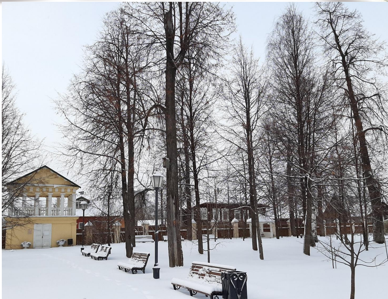
Парк, в котором любила гулять мама Петра Ильича.