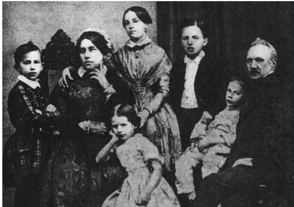
Семья Чайковских в 1848 году (крайний слева — Пётр Ильич)

Пётр Ильич Чайковский родился 7 мая 1840 года в Воткинске Вятской губернии. Отец - Илья Петрович - начальник Воткинского завода. Он был жизнерадостный, добрый и прямодушный человек. Мать – Александра Андреевна - добрая, но строгая женщина.