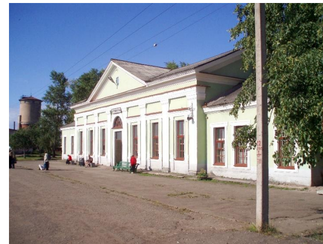
Вокзал Сущёво – «Ворота области». Он же – «Окно в Европу»

Нетрудно представить, что сегодня является собой станция «Сущёво», эти бежаницкие «ворота области» или «окно в Европу»: заштатный полустанок, на котором в силу необъяснимых, большей частью технологических причин имеют 2-х минутную остановку 8 пар пассажирских поездов дальнего следования, включая поезда Белорусских и Латвийских железных дорог, с вагонами беспересадочного сообщения до Праги, Варшавы и Вены