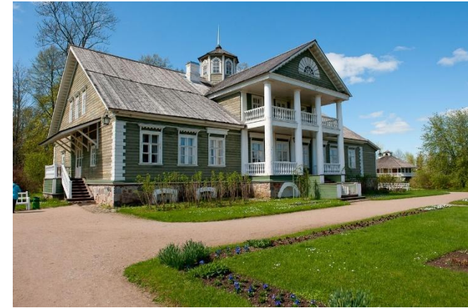
Уикенд в Пушкиногорье

Петербуржец пробудет в музее-заповеднике с нуля часов субботы по 23.20 воскресенья. При этом он выедет из Северной столицы в 17.20 пятницы, а вернется – в 6.12 утра в понедельник и успеет перед работой заехать домой