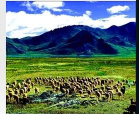
Стадо домашних животных и трава