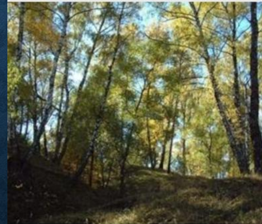
Деревья и травы

Одна популяция подавляет другую, но сама не испытывает отрицательного влияния