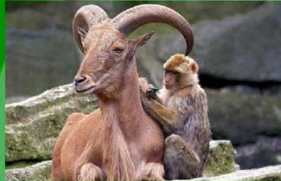
4. Симбиоз ( взаимовыгодные отношения )