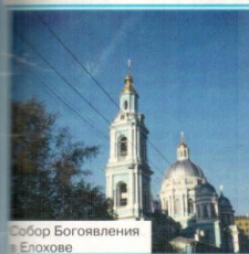
Собор Богоявления в Елохове