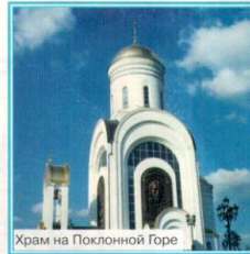
Храм на Поклонной Горе