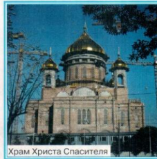
Храм Христа Спасителя