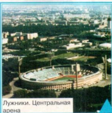
Лужники. Центральная арена