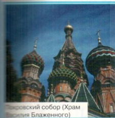
Иоанновский собор (Храм Василия Блаженного)