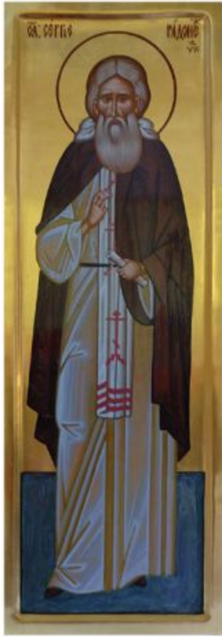
Святой Сергий Радонежский