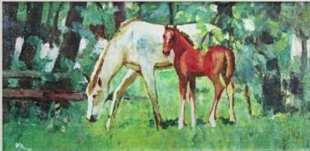
Н. Калугина «Жеребёнок»

« Жеребёнок». Бежит жеребёнок В степи по дорожке- Шелковая шейка Точеные ножки. Е. Щеколдин.