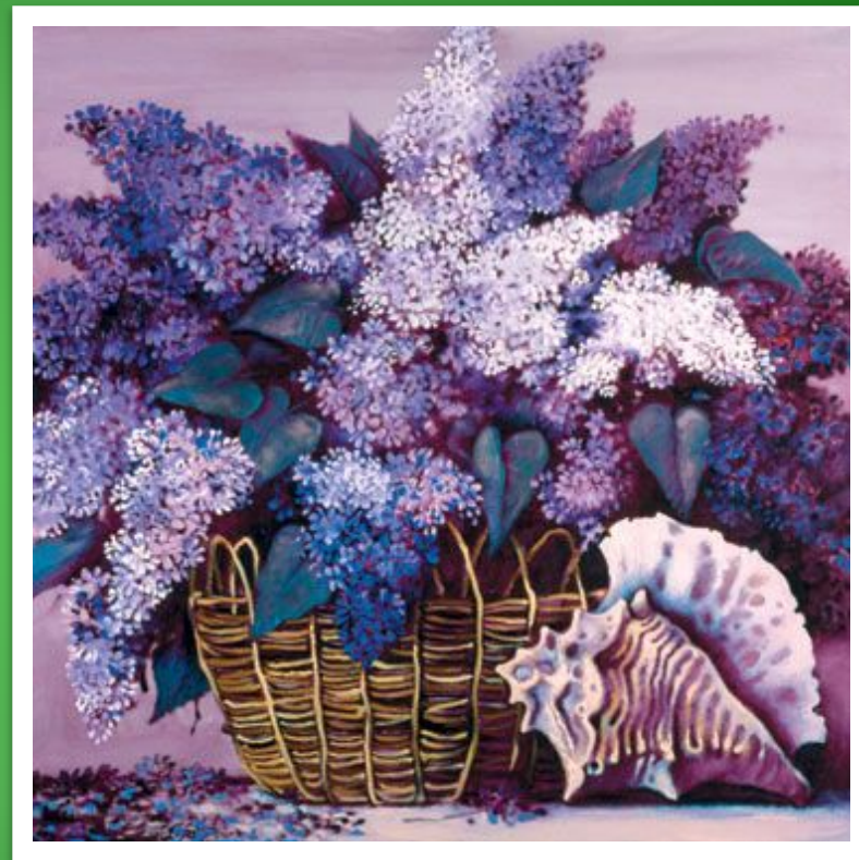
С. Воржев «Запах сирени»