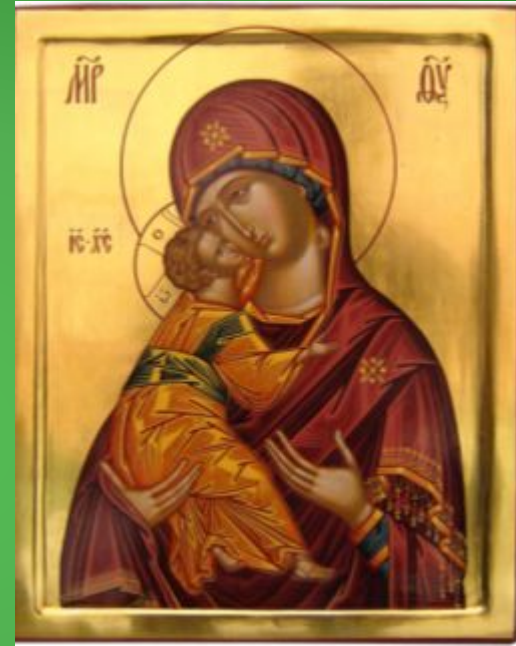
Образ Пресвятой Богородицы Владимирская

« Божья Мать на престоле стояла Иисуса Христа на руках держала. Радуйтесь, люди, Христос с вами будет...»