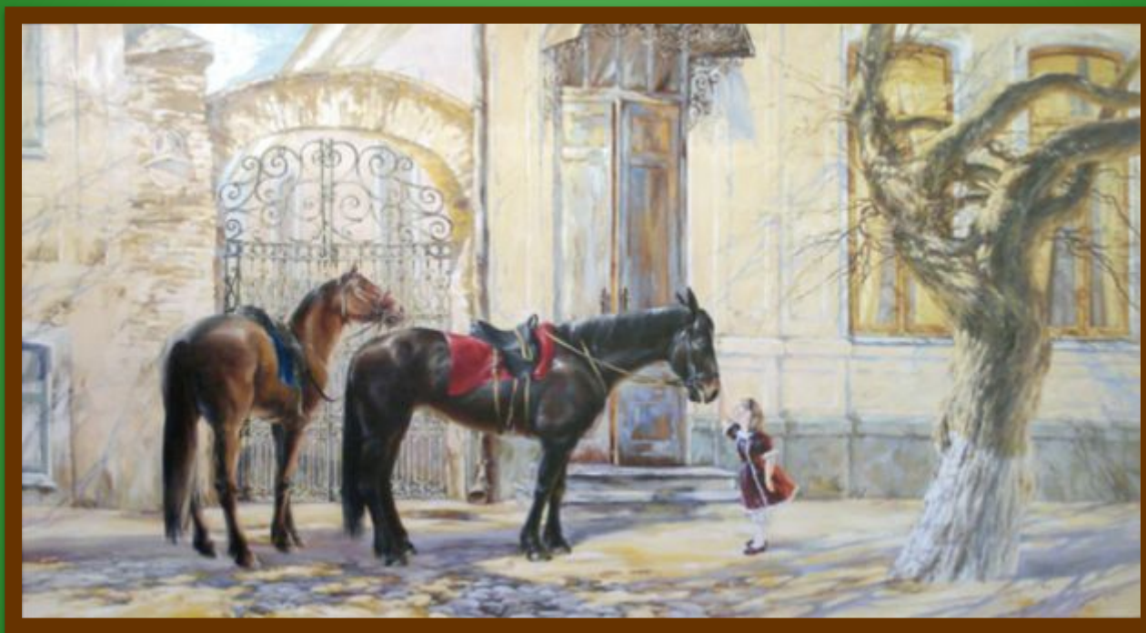
А.Бруно «Весна старого города»