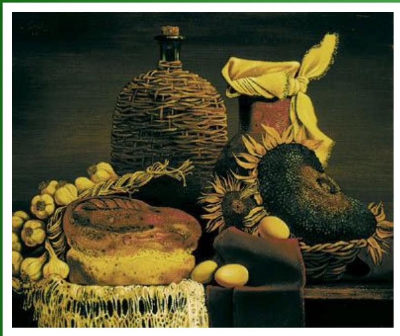
С. Воржев «Кубанский натюрморт»