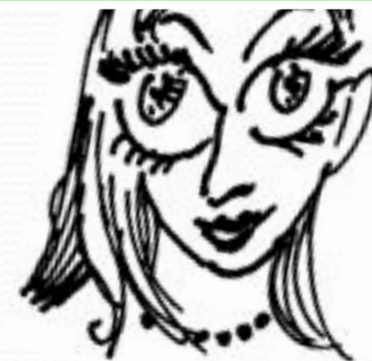
Делать большие глаза