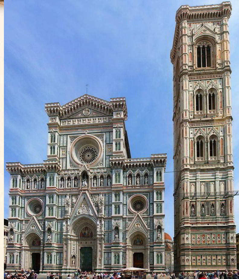
Собор Санта-Мария-дель-Фьоре где в 1439 году была подписана Флорентийская уния

Этим документом признавался догмат о главенстве папы Римского над всеми христианскими церквями, но сохранялось для православия право совершать обряды по его каноническим правилам.