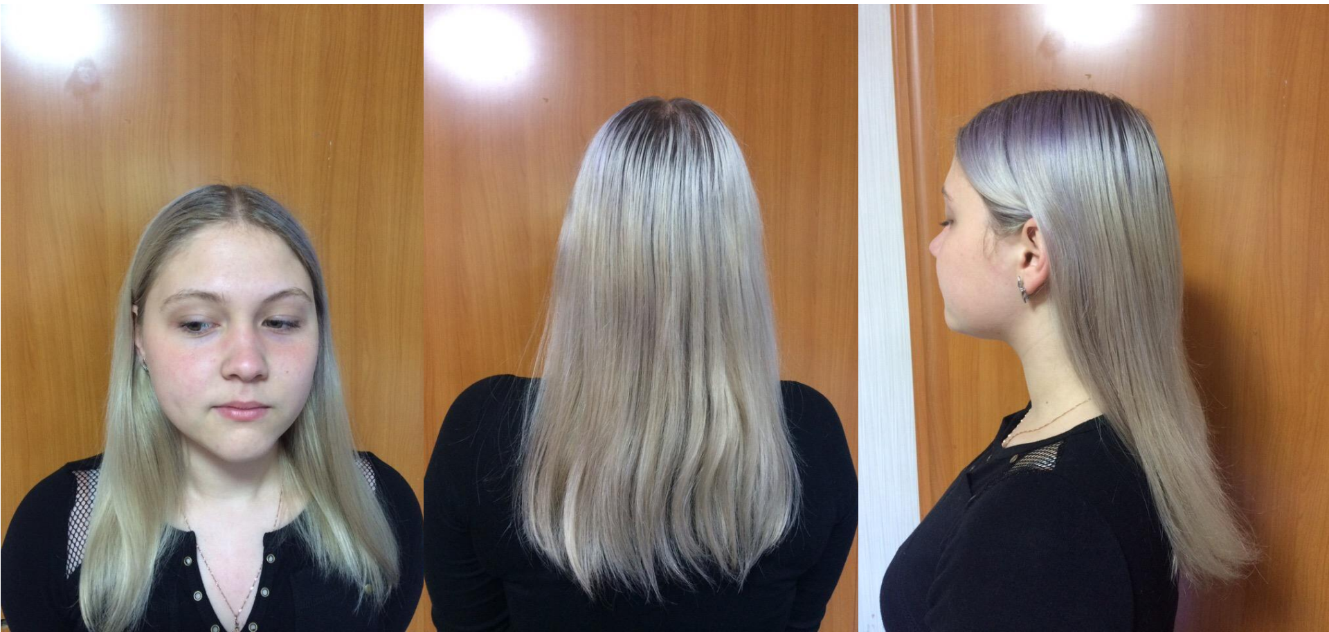
Фото до в 3х ракурсах