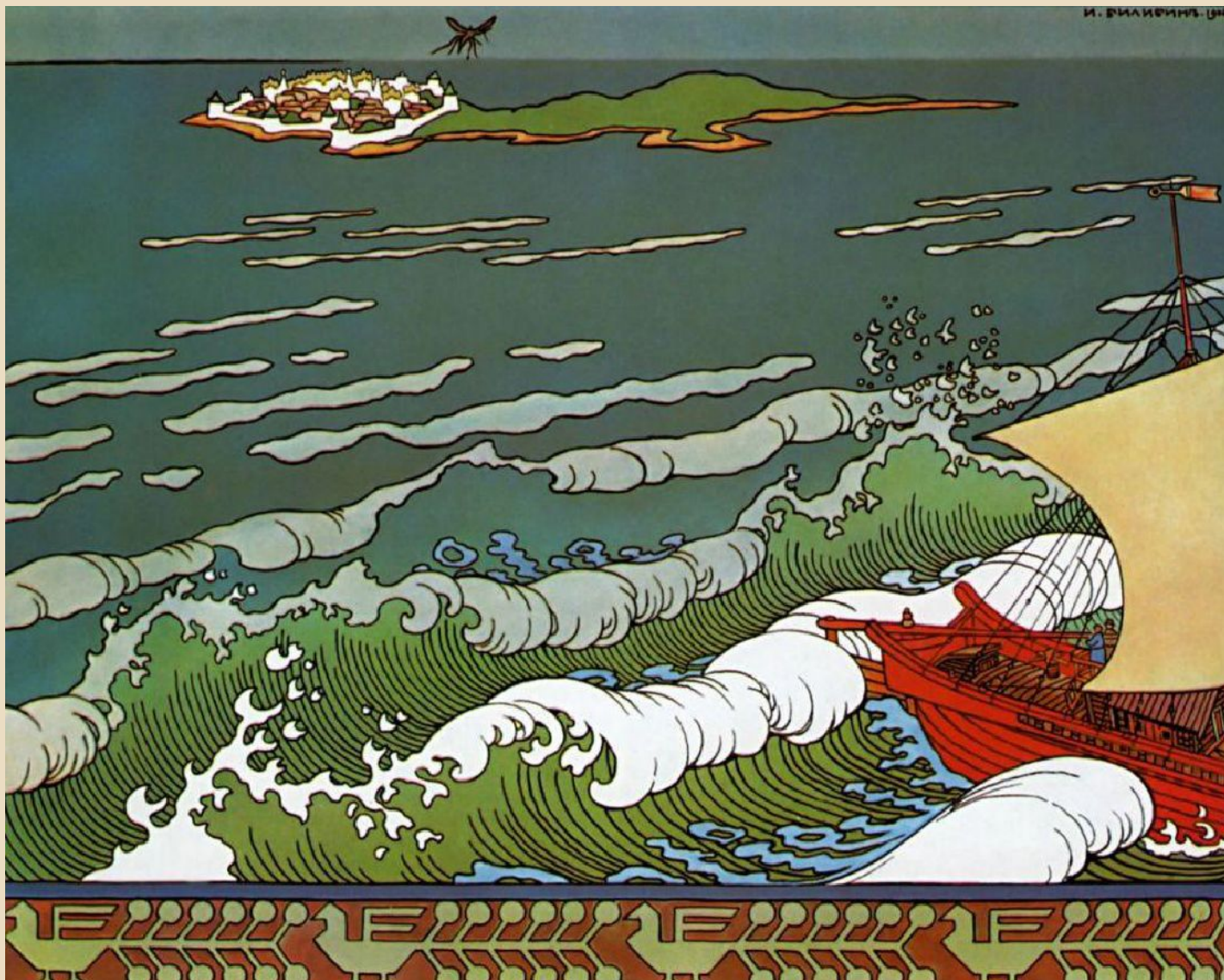
Билибин И.Я. «Иллюстрация к сказке о царе Салтане»