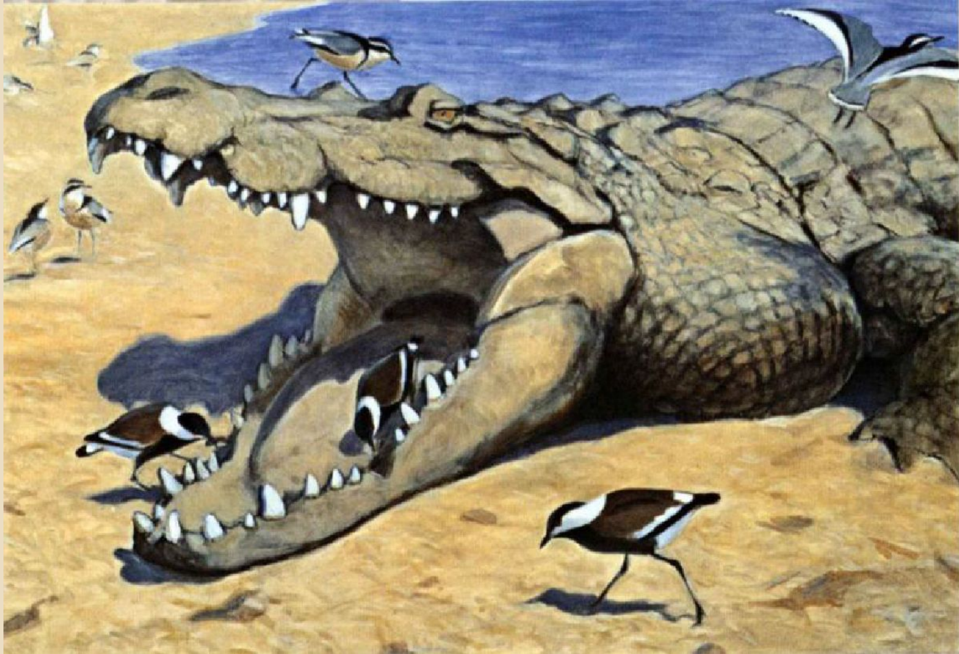
Ватагин В.А. «Крокодилова зубочистка», 1920г. Акварель.