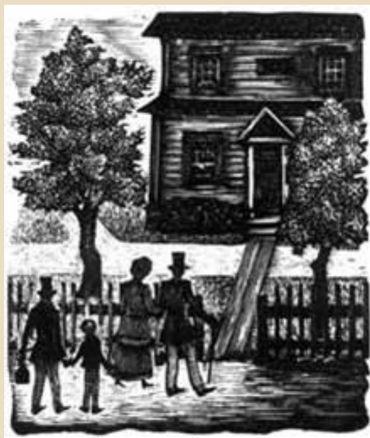
Гравюра на дереве