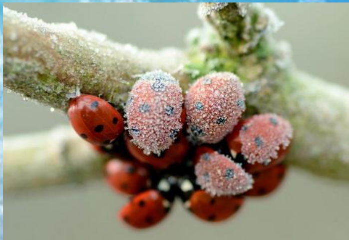
В компании зимовать теплее