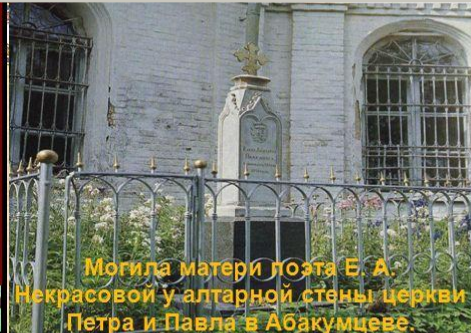
Любимое место прогулок матери поэта