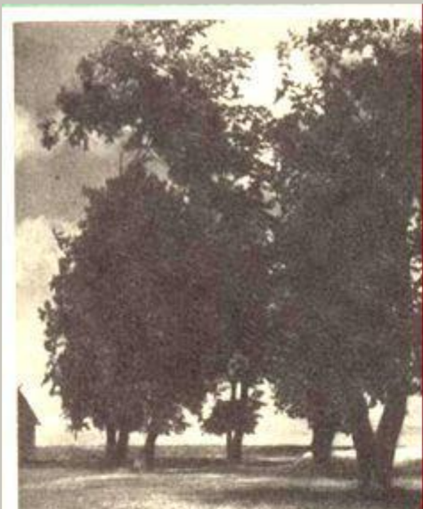
Любимое место прогулок матери поэта