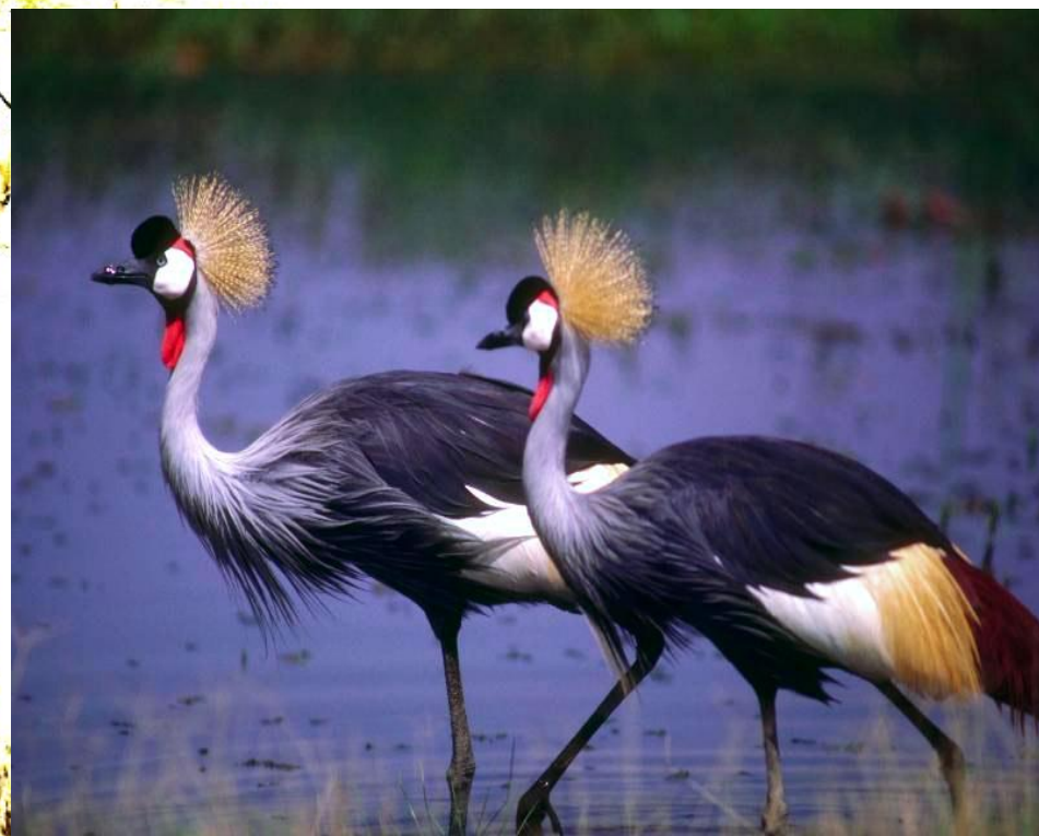
Восточный венценосный журавль