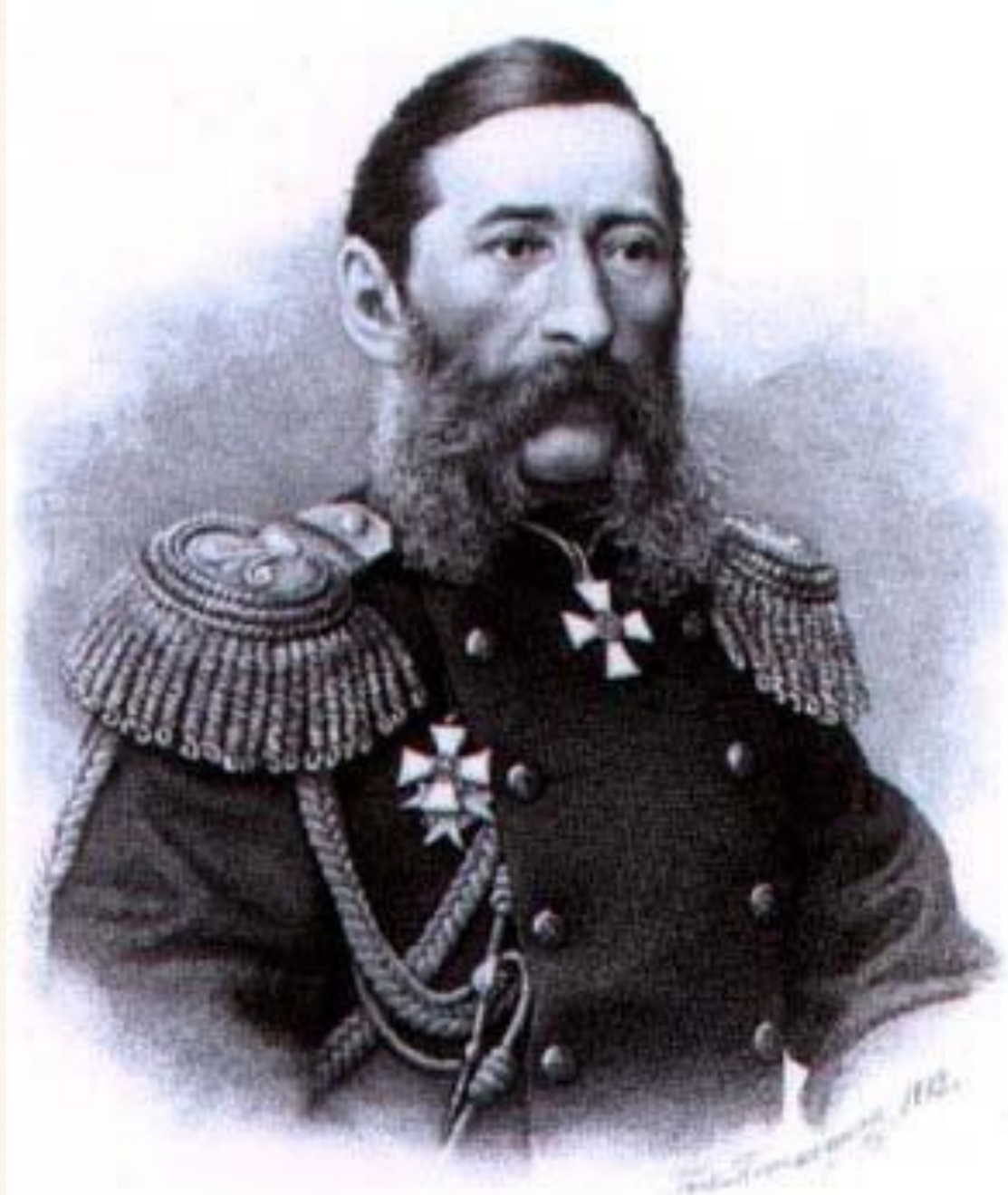
М.Т. Лорис - Меликов. 1882. Гравюра Пожалостина.