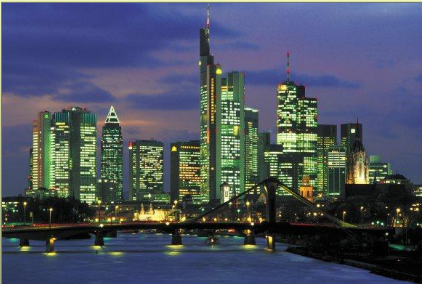
Франкфурт - на - Майні