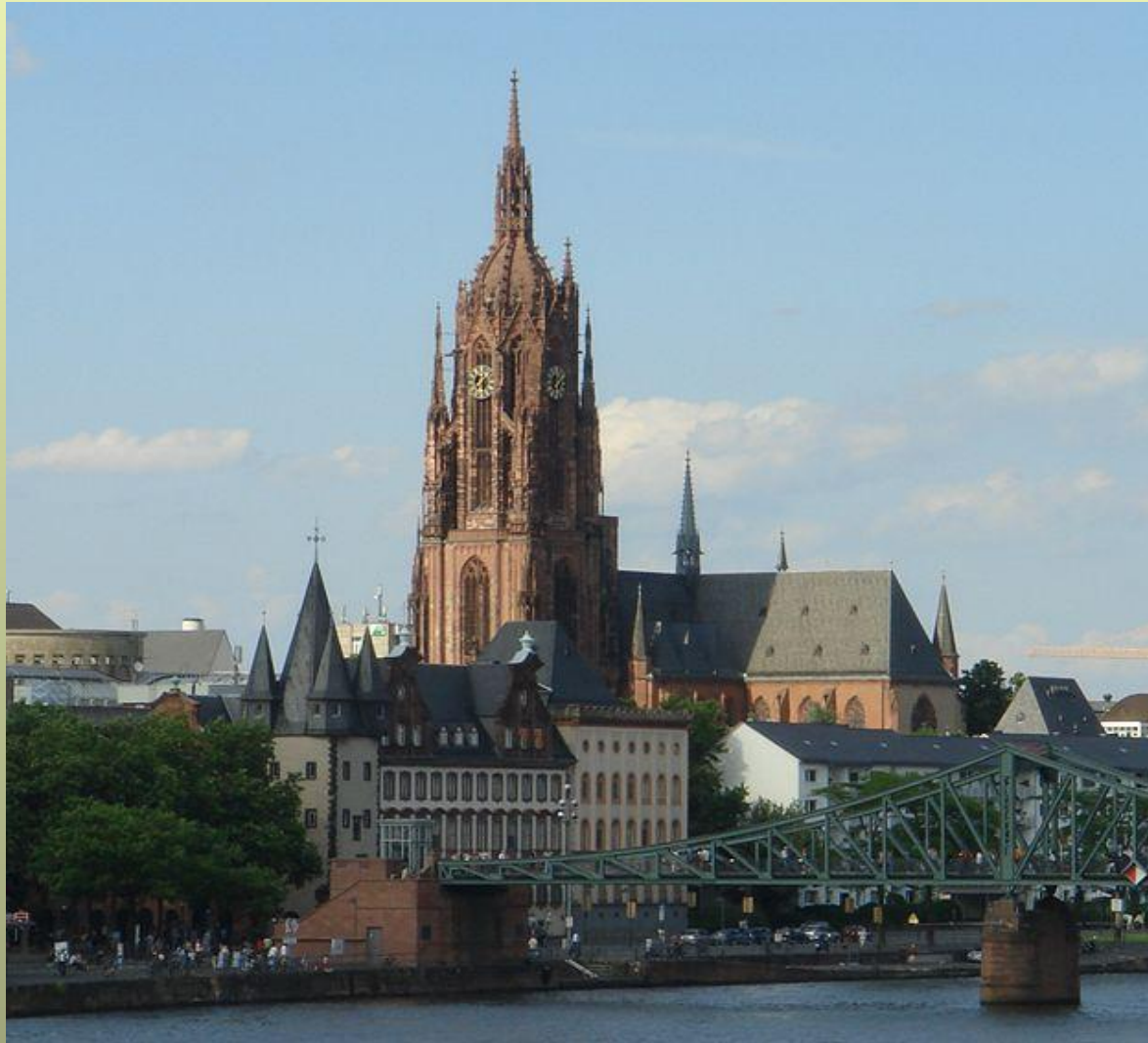
Собор Франкфурт - на - Майні