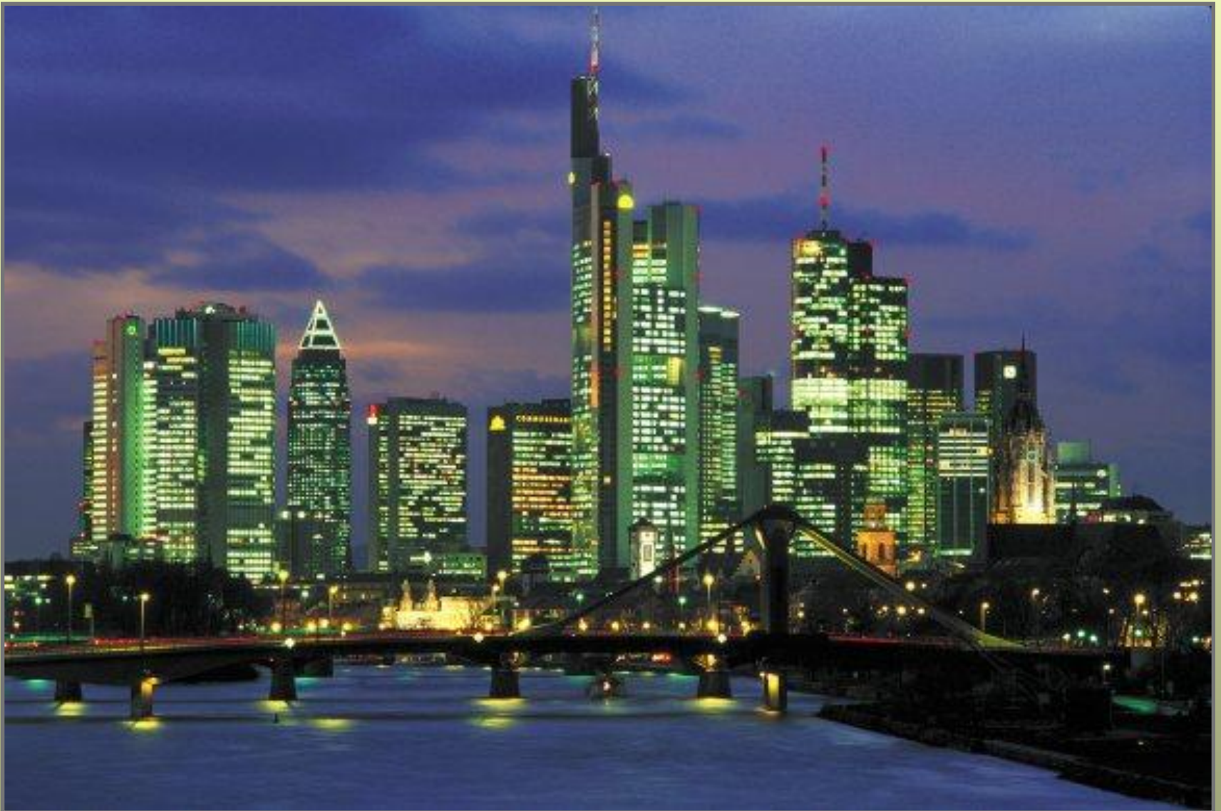
Франкфурт - на - Майні