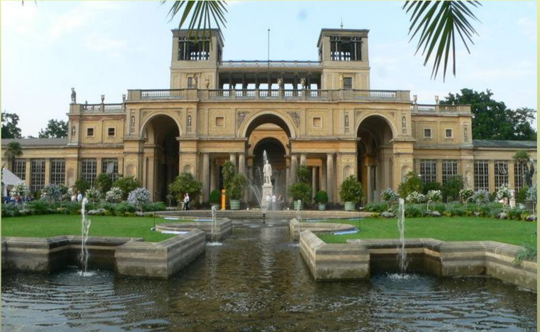
Парк Сан - Сусі. Потсдам