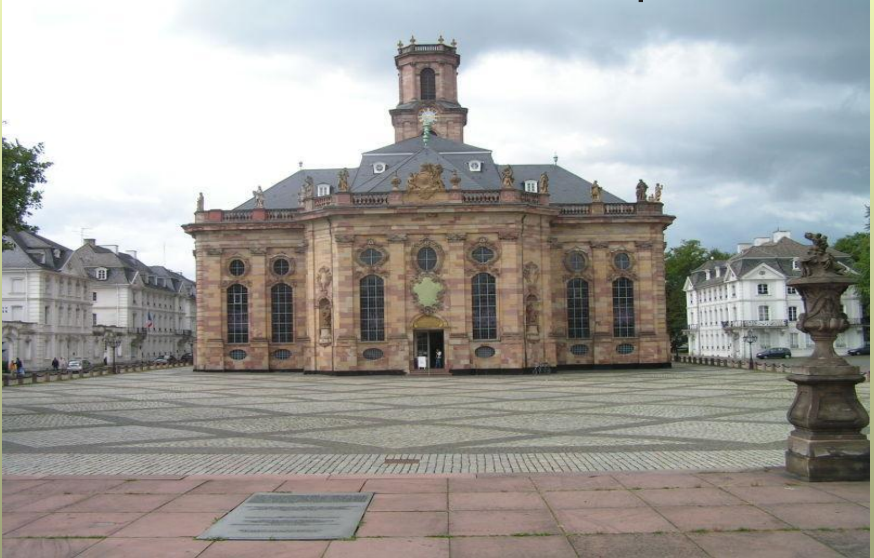
Собор Святого Павла. Саарбрюкен