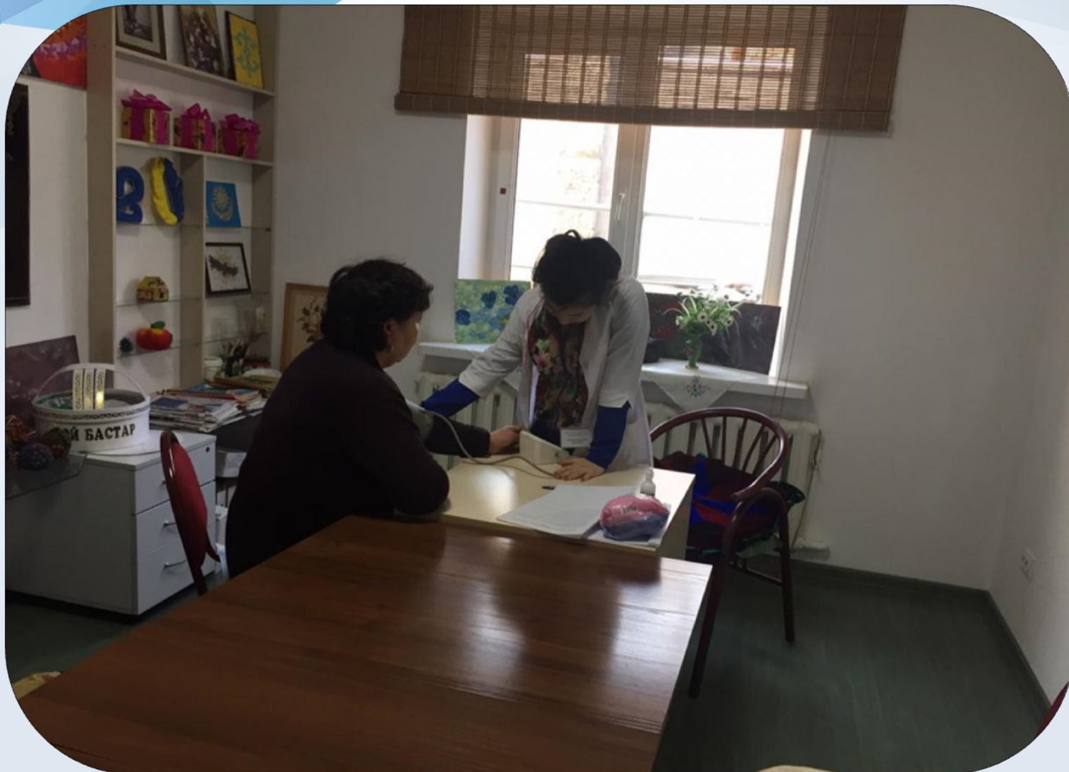
Ежедневный мониторинг состояния пенсионеров