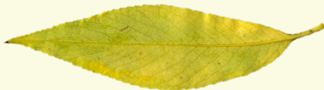
Лист ивы ( тонкие золотые рыбки)