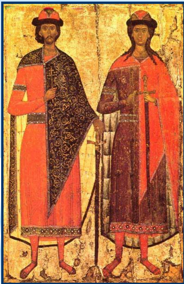
Борис и Глеб

В ходе борьбы за власть Святополк убивает своих братьев – Бориса и Глеба. Оба они не хотели кровопролития.