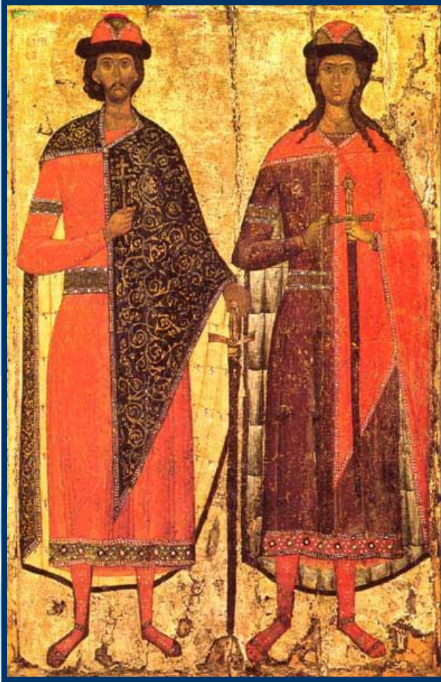
Борис и Глеб

Борис и Глеб избрали христианский путь непротивления злу, отказ от борьбы во имя высших государственных, нравственных и религиозных идеалов.