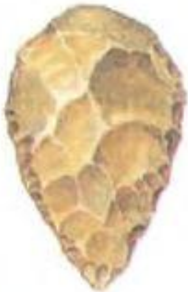
Каменное рубило. Найдено при рас- копках.