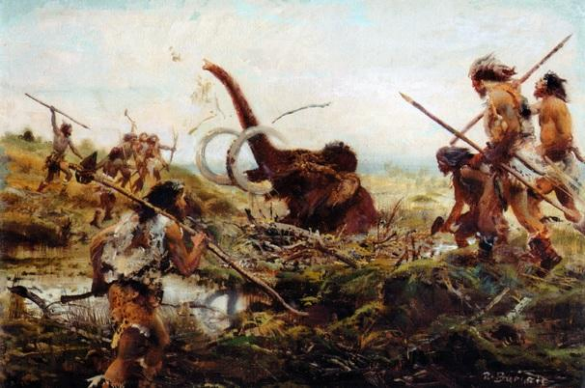
Загонная охота на мамонтов.