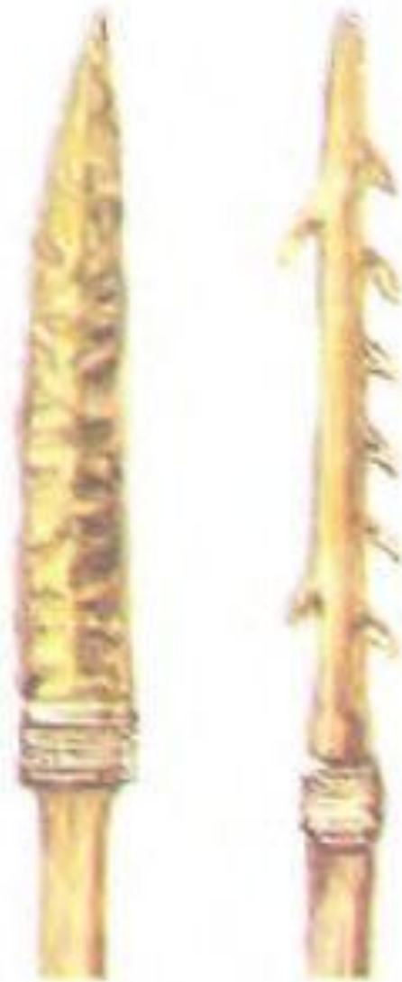
Каменный наконеч- ник копья и костя- ной наконечник гарпуна.