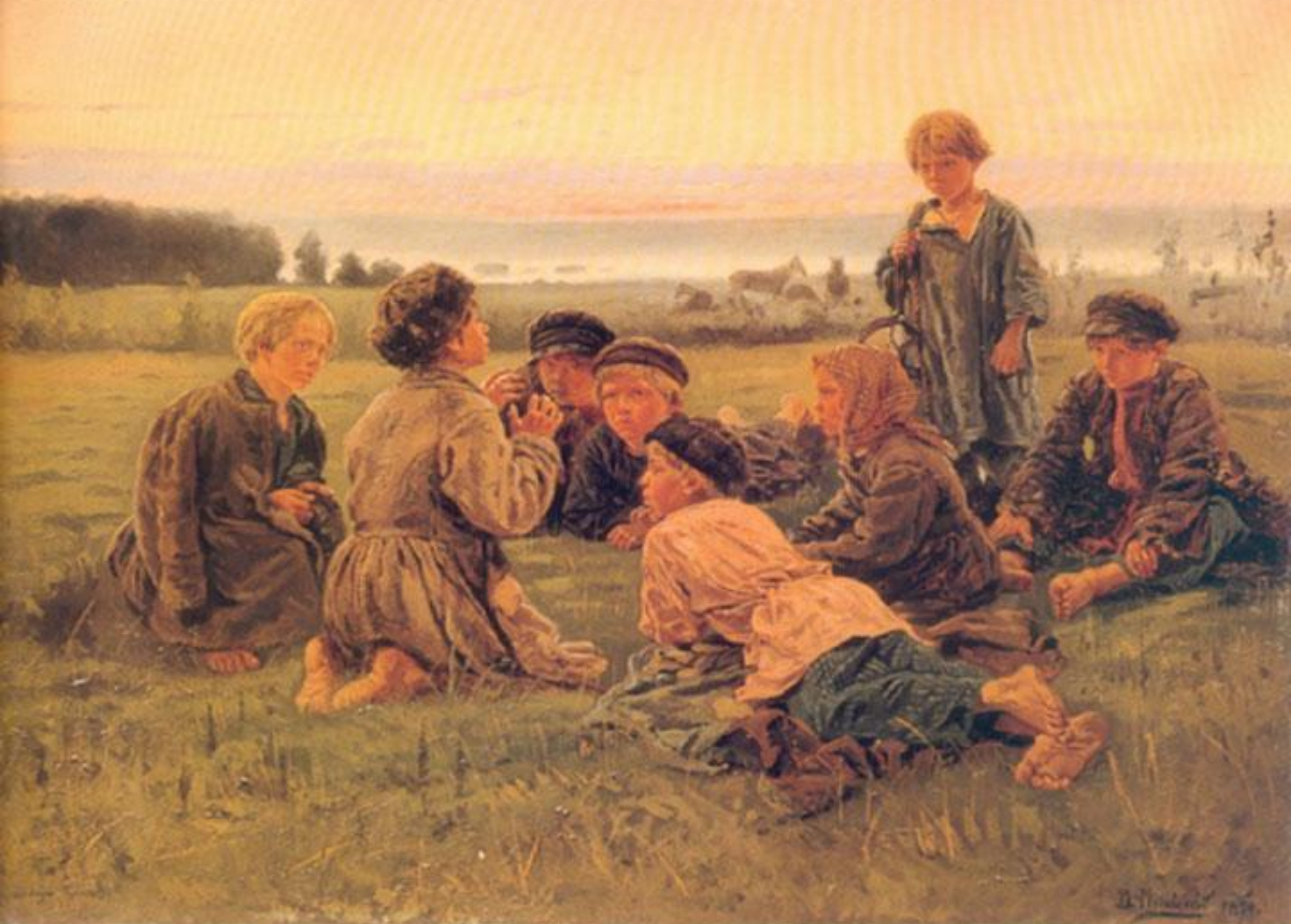
В. Е. Маковский. Ночное. 1879. Холст, масло.