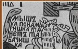
3. «Мышки kota погребают». Рядом с одной из мышей четко видна подпись: «Мышка пономаришка тянет табачишка». Мода на курение табака была введена в России Петром I.