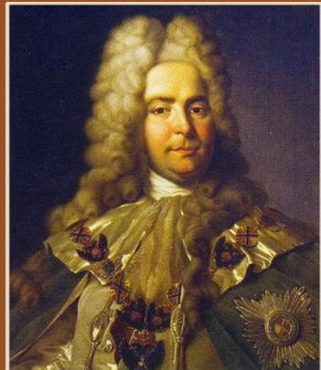
ПАВЕЛ ИВАНОВИЧ ЯГУЖИНСКИЙ