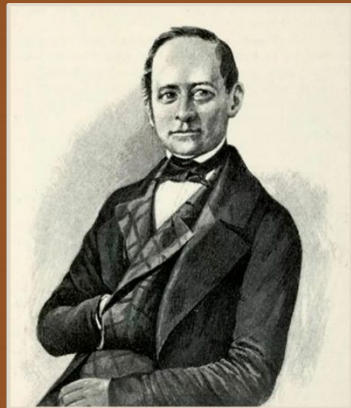
МАГНИЦКИЙ ЛЕОНТИЙ ФИЛИПОВИЧ