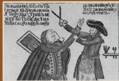
1. «Дирюльник стрижет раскольника». На картинке нашел отражение петровский указ 1698 года о бритье бород.