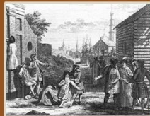
2. «Укорочение кафтанов на заставе». В 1700 году Петр издает указ о ношении европейского платья. Нарушителей этого указа предписывалось поставить на колени и обрезать одежду наравне с землей.