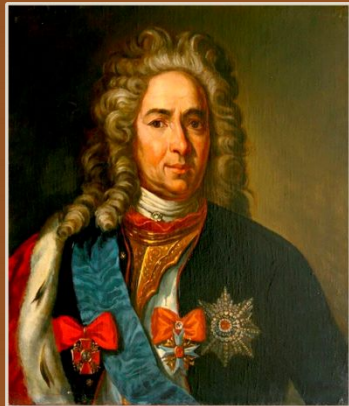
АЛЕКСАНДР ДАНИЛОВИЧ МЕНШИКОВ