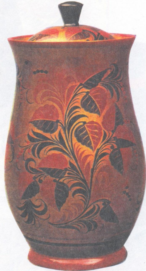
2. Н. Салтыкова. Горшочек. 1967. “Верховое” письмо (под листок)