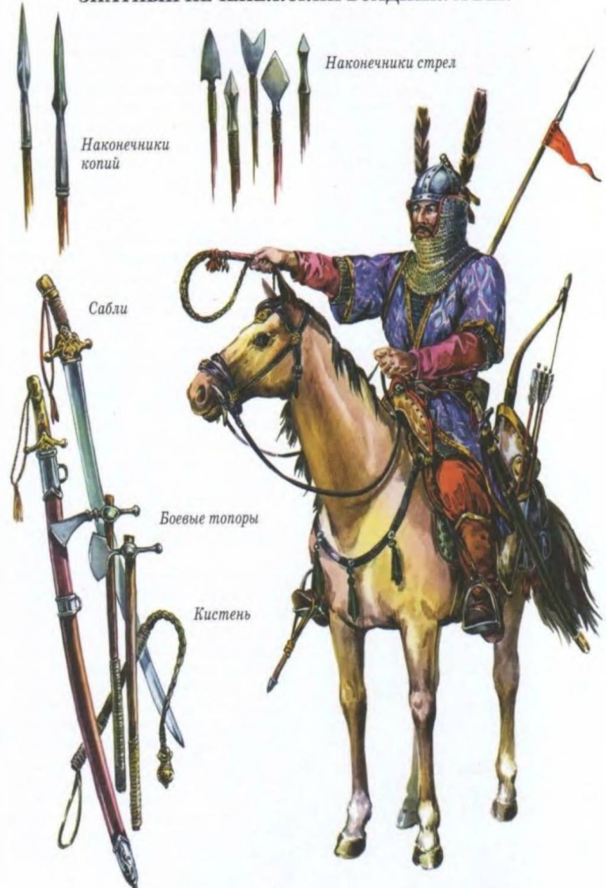
ЗНАТНЫЙ ПЕЧЕНЕЖСКИЙ ВСАДНИК. X ВЕК

Печенеги – кочевые тюркские племена, впервые упоминаемые в VIII веке. Возглавлял печенегов хан, под руководством которого они постоянно нападали на соседей, захватывали в плен людей, чтобы получить за них выкуп, уводили скот.