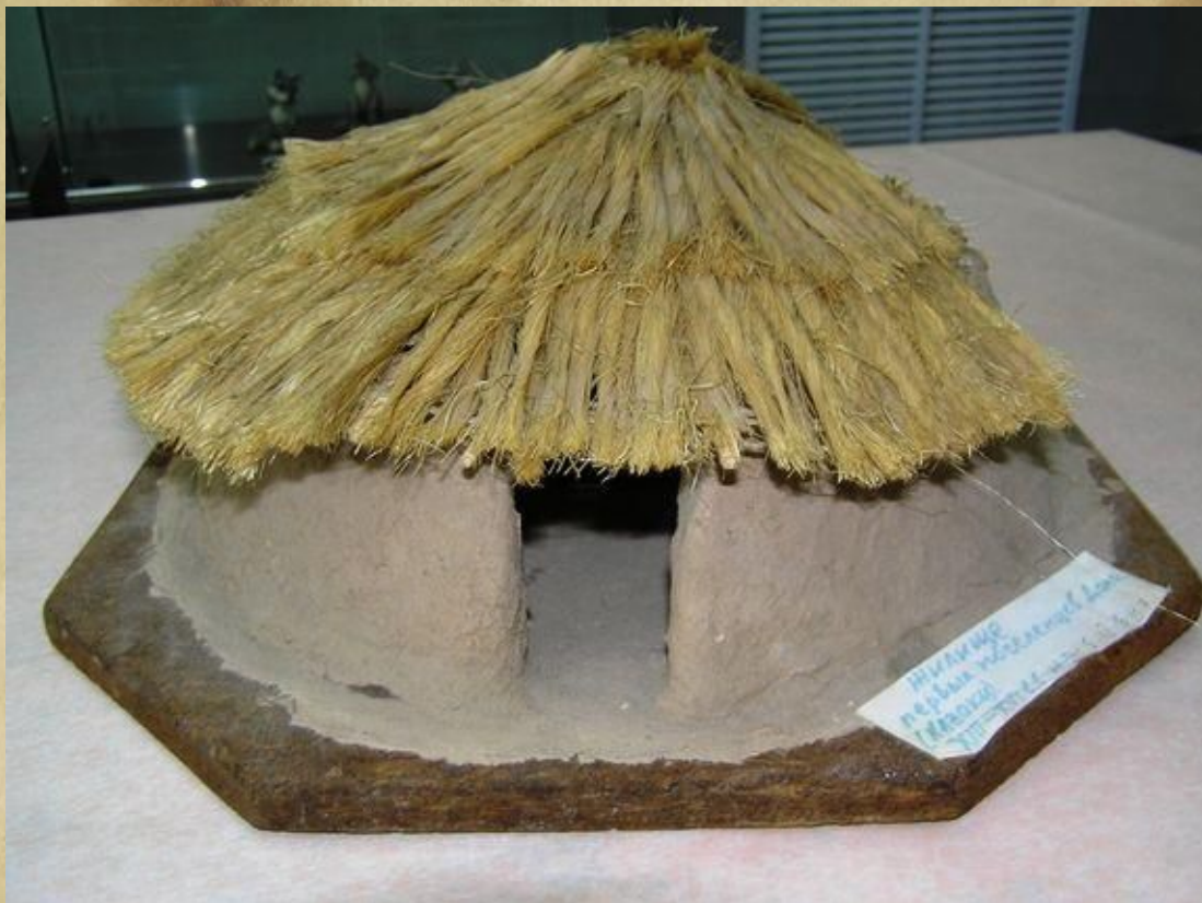
Хазарское жилище – юрта (реконструкция)