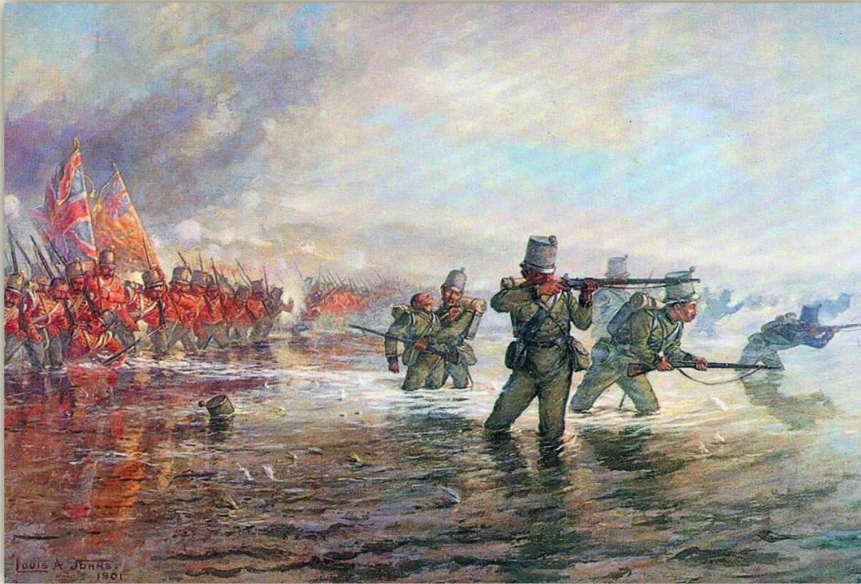
Второй батальон Стрелковой бригады британских войск переправляется через Альму

Французские и британские пехотинцы бросились штурмовать Телеграфный холм, а там никого нет. Этот участок обороны находился в командовании генерал-лейтенанта Василия Кирьякова, командира 17-й пехотной дивизии.