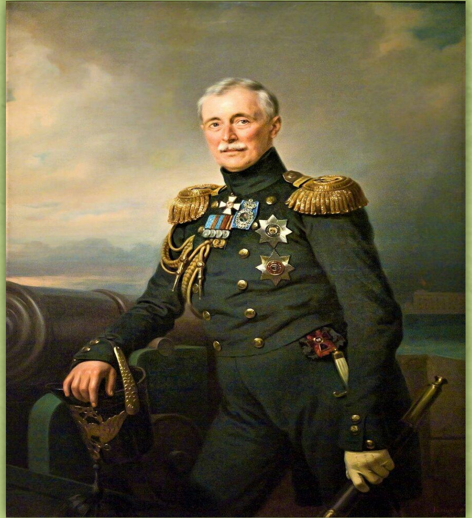
Портрет князя А.С Меншикова

Все же, как рассчитывал князь Александр Меншиков, войска коалиции на какое-то время были остановлены. И это промедление позволило лучше укрепить оборону Севастополя со стороны суши и подготовиться к встрече неприятеля. Историки считают сражение на Альме прелюдией к обороне Севастополя, когда героизм и самоотречение русского народа позволили продержаться городу 349 дней.