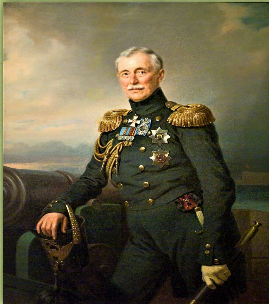
Портрет князя А.С Меншикова

Все же, как рассчитывал князь Александр Меншиков, войска коалиции на какое-то время были остановлены. И это промедление позволило лучше укрепить оборону Севастополя со стороны суши и подготовиться к встрече неприятеля. Историки считают сражение на Альме прелюдией к обороне Севастополя, когда героизм и самоотречение русского народа позволили продержаться городу 349 дней.