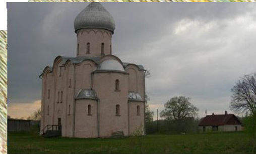
Церковь Спаса на Нередице — храм Преображения Господня, расположенный в 1,5 км к югу от Великого Новгорода на правом берегу бывшего русла Малого Волховца, на небольшой возвышенности рядом с Рюриковым городищем.