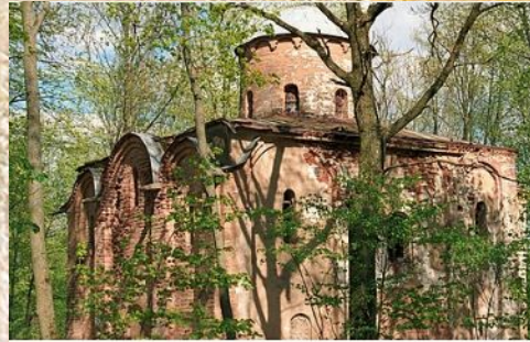
Церковь Петра и Павла на Синичьей горе — российский архитектурный памятник, расположенный в Великом Новгороде.

Храмы Новгорода эпохи политической раздробленности уже не поражают огромными размерами, однако в них сохраняются основные черты данной архитектурной школы. Они отличаются простотой и некоторой тяжеловесностью форм. В конце XII века были построены такие храмы как церковь Петра и Павла на Синичьей горе (1185), церковь Уверения Фомы на Мячине (1195) (на её фундаменте в 1463 году построена новая церковь с тем же именем). Заметным памятником, завершившим развитие школы в XII веке, стала церковь Спаса на Нередице (1198). Построена за один сезон при новгородском князе Ярославле Владимировиче. Храм одноглавый, кубического типа, четырёхстолпный, трёхапсидный. Фресковые росписи занимали всю поверхность стен и представляли собой один из уникальных и значительных живописных ансамблей России.