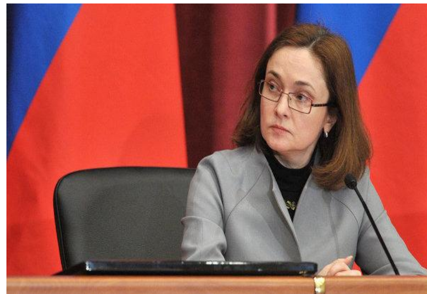
Председатель Центрального банка РФ Набиулина Э. С.