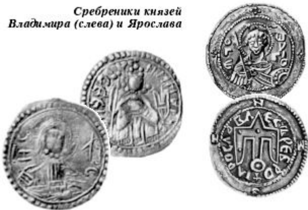
Серебряники князей Владимира (слева) и Ярослава

а, их асти. а к асть обра. ) на куна, дски.