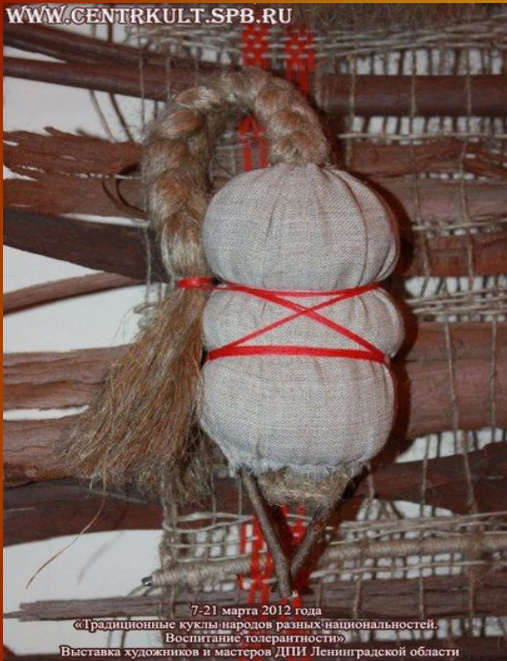
7-21 марта 2012 года «Традиционные куклы народов разных национальностей. Воспитание толерантности» Выставка художников и мастеров ДПИ Ленинградской области