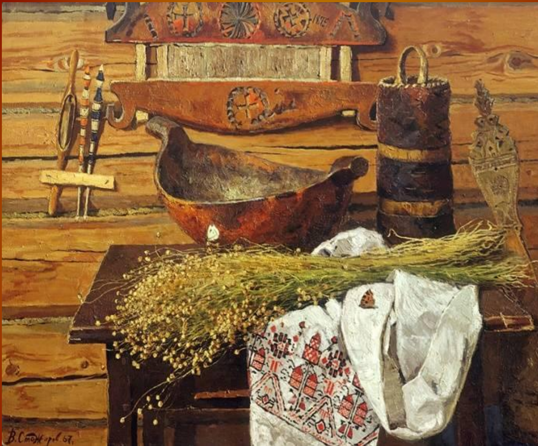
Стожаров Владимир Федорович Лён холст / масло 1967