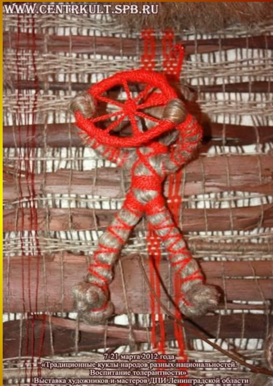
7-21 марта 2012 года «Традиционные куклы народов разных национальностей. Воспитание толерантности» Выставка художников и мастеров ДПИ Ленинградской области