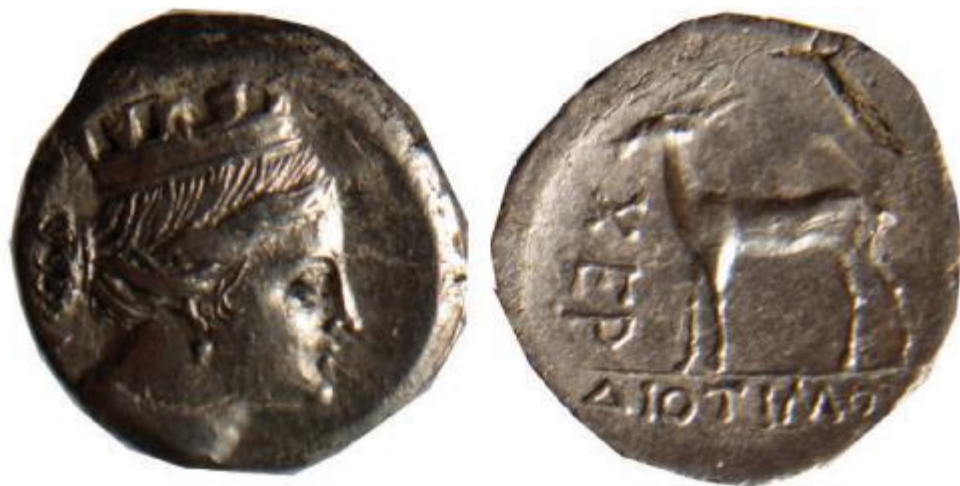
Дева в башенной короне. Серебро, конец 3 в. до н.э.