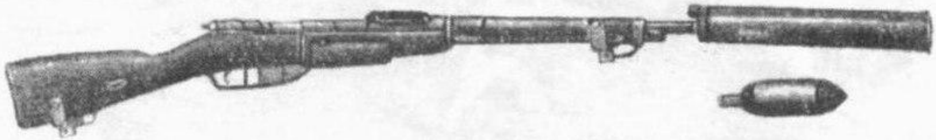
Партизанский ружейный гранатомет Шавгулидзе (ПРГШ) и макет гранаты к нему