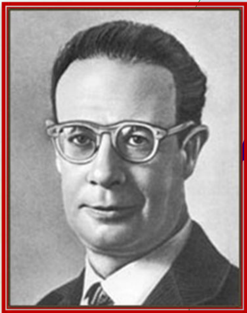
Лев Абрамович Кассиль (1905-1970)