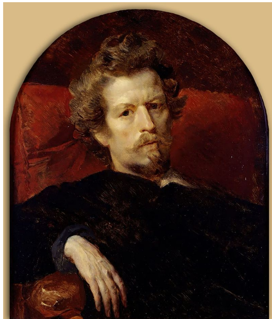
К. Брюллов «Автопортрет»

КАРЛ БРЮЛЛОВ (1799 – 1852) – яркий представитель классицизма и романтизма, автор жанровых и исторических полотен, единственный русский художник, удостоенный при жизни лаврового венка и бриллиантового перстня из рук императора. За «Последний день Помпеи» его называли «первой кистью государства» . Брюллов создал более 200 парадных и камерных портретов и расписал купол Исаакиевского собора площадью 800 квадратных метров.