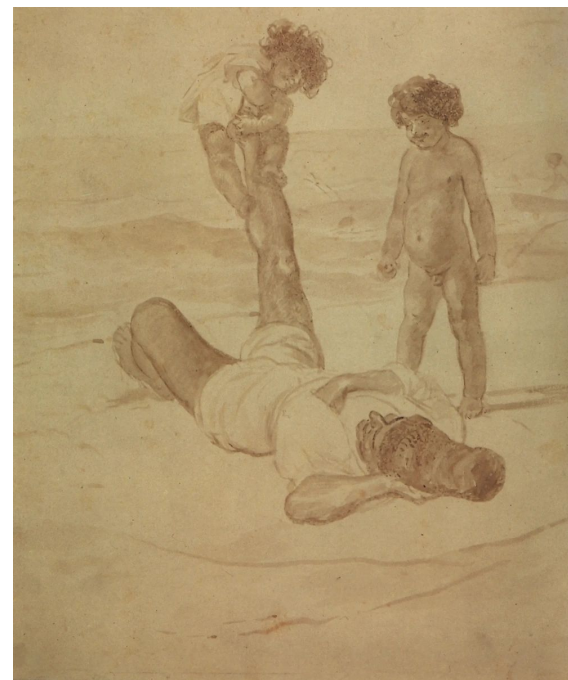
Из серии «Лаццарони на берегу моря»