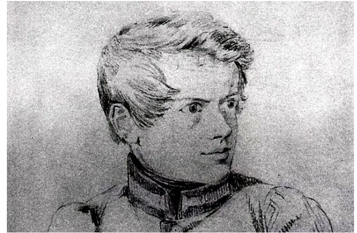
Карл Брюллов в детстве