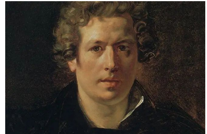
Карл Брюллов в юности