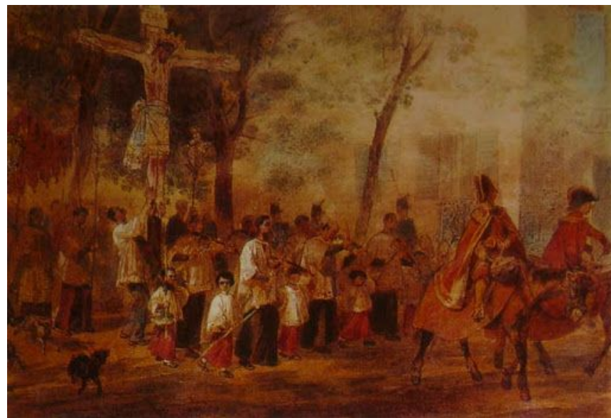
«Процессия слепых в Барселоне»

В апреле 1849 г. Карл Брюллов отправился на лечение за границу - на остров Мадейра, а затем в Италию, где и провел последние годы. Он познакомился с итальянским революционером Анджело Титтони и до конца жизни был под покровительством его семьи. Под влиянием Титтони Брюллов начал писать картины с современными сюжетами. Так появились первые реалистические работы - полотно «Процессия слепых в Барселоне» , серия сепий «Лаццарони на берегу моря» . Карл Брюллов умер в Манциане, недалеко от Рима. Похоронен на римском протестантском кладбище Монте-Тестаччо.