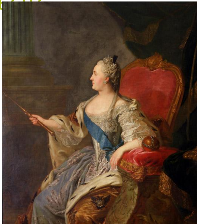
Рокотов. Портрет Екатерины II.