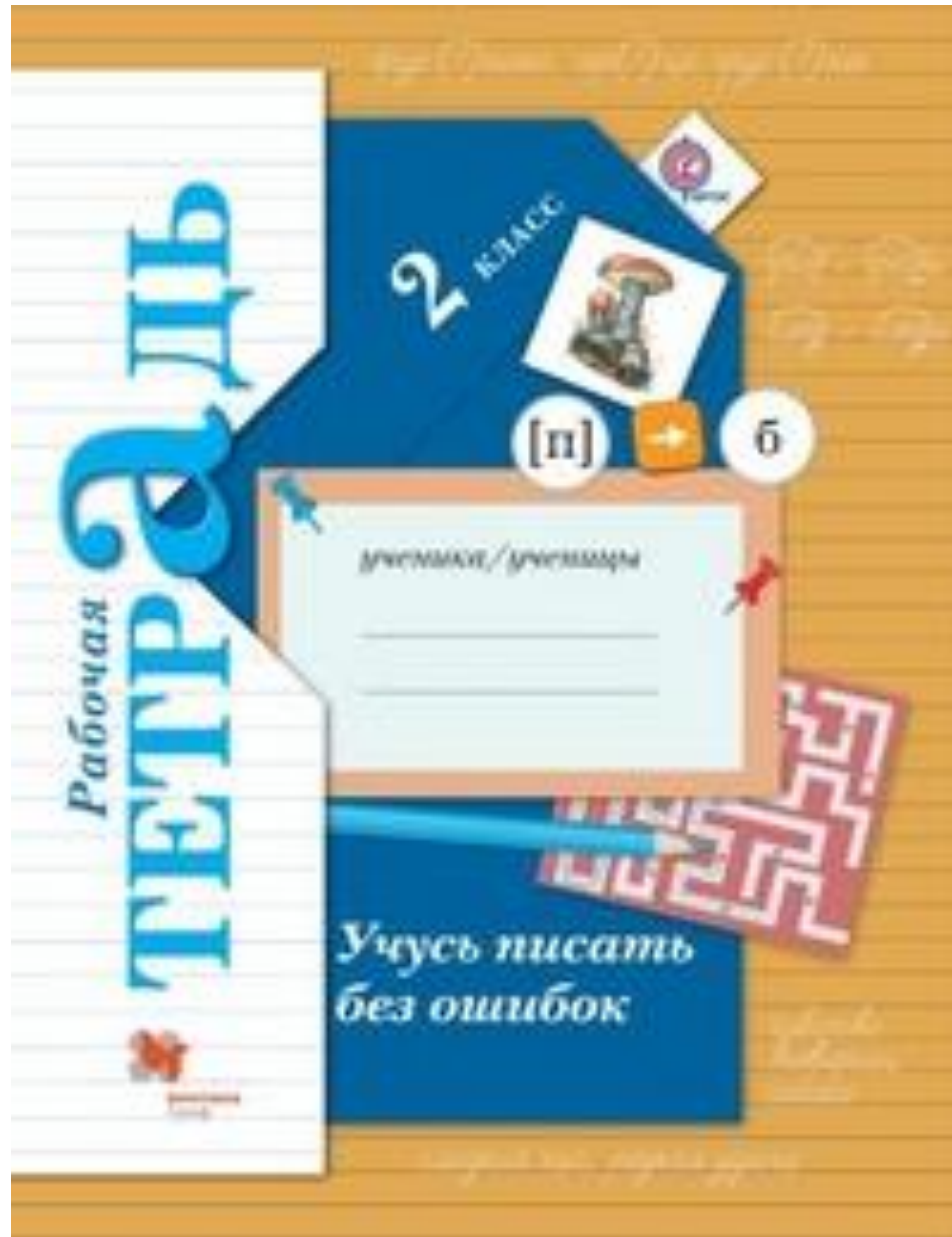
Рабочая тетрадь к учебнику по русскому языку Иванова С.В.