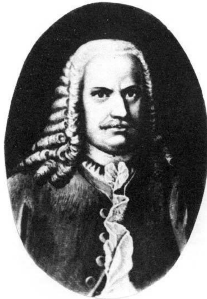
Никита Никитич Демидов