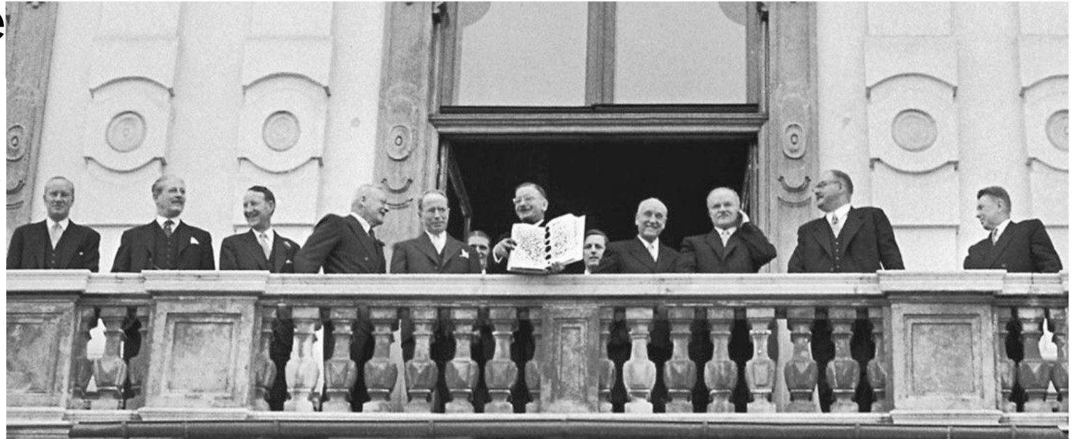
Министр иностранных дел Австрии Леопольд Фигль показывает с балкона дворца Бельведер ликующему народу только что подписанный Государственный договор. Вена. 15 мая 1955 года, СССР представляет Министр иностранных дел В.М.Молотов

Договор подписали от союзников: министры иностранных дел: Вячеслав Молотов (СССР), Джон Фостер Даллес (США), Гарольд Макмиллан (Великобритания), Антуан Пинэ (Франция) и от Австрии министр иностранных дел Австрии Леопольд Фигль, а также четыре верховных комиссара оккупационных сил: Иван Ильичёв (СССР), Левеллин Е. Томпсон мл. (США), Джеффри Арнольд Уоллинггер (Великобритания), Роже Лалуэтт (Франция).