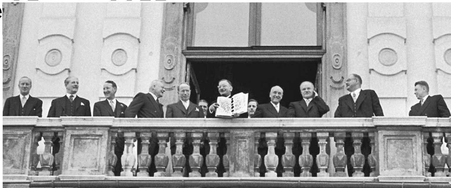
Министр иностранных дел Австрии Леопольд Фигль показывает с балкона дворца Бельведер ликующему народу только что подписанный Государственный договор. Вена. 15 мая 1955 года, СССР представляет Министр иностранных дел В.М.Молотов

Иван Ильичёв Левеллин Е. Томпсон Антуан Пинэ Леопольд Фигль