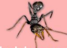
Jack jumper ant

Myrmecia pilosula