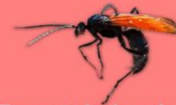
Tarantula hawk wasp