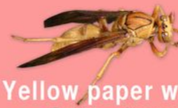
Yellow paper wasp