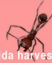
Florida harvester ant

Polistes flavus