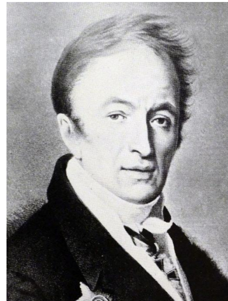
Николай Михайлович Карамзин — российский историк

«Три предмета должны были быть главными для политики государя Московского: надлежало прервать или облегчить цепи, возложенные ханами на Россию; удержать стремление Литвы на ее владения; усилить Великое княжество присоединением к оному уделов независимых. В сих трех отношениях Василий Дмитриевич действовал с неусыпным попечением, но держась правил умеренности, боясь излишней торопливости и добровольно оставляя своим преемникам дальнейшие успехи в славном деле государственного могущества»